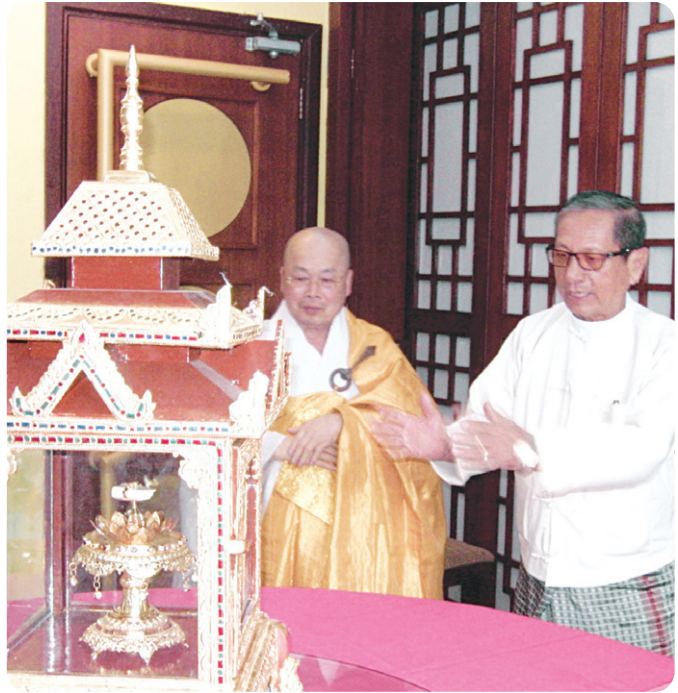
▶ 6월 14일 : 부처님 치아사리 (우 미인 아웅 전 종교성 장관 / 종교성)

특히 미얀마 연방승가회 회장(종정 닥터 우 꾸마라) 큰스님 친견 때에는 격려와 찬사의 말씀을 주시며 더욱더 분발하고 큰 발전이 있기를 기원하는 뜻에서 사바세계에 나투시기 조차 어려운 성스러운 성보 부처님의 성발과 중국 불교회 주관으로 중국전역에서의 친견법회와 미얀마 정부의 주관 하에 2번에 걸쳐 전국 친견법회를 봉행하였던 부처님 치아사리를 목탁스님에게 내려 주셨다. 2500여년이 넘어 우리에게 오신 성스러운 부처님 성발과 치아사리는 前 미얀마 종교성 장관의 배려로 감당하기 힘든 희열과 감격속에 여법히 한국으로 이운하여 임시 법왕청사에 봉안하였다.