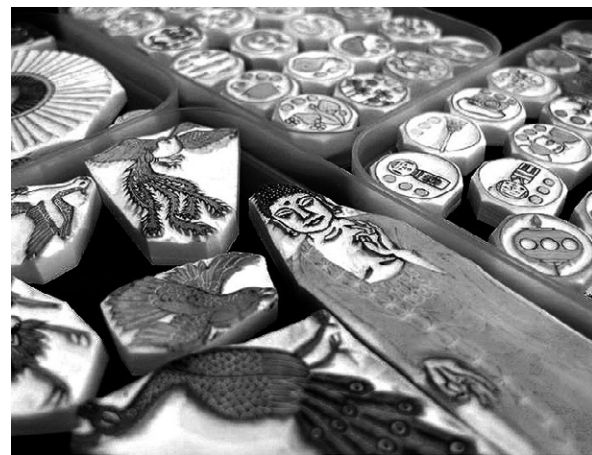
'스님'만이 그릴 수 있는 독특한 그림으로 지역사회에 공헌하는 부 로스 스님. 사람들의 참여를 이끌어내 작품 속에 연기의 세계를 담으려고 한다. 옆 사진은 드래곤 불의 등장인물이 좌선하고 있는 모습.