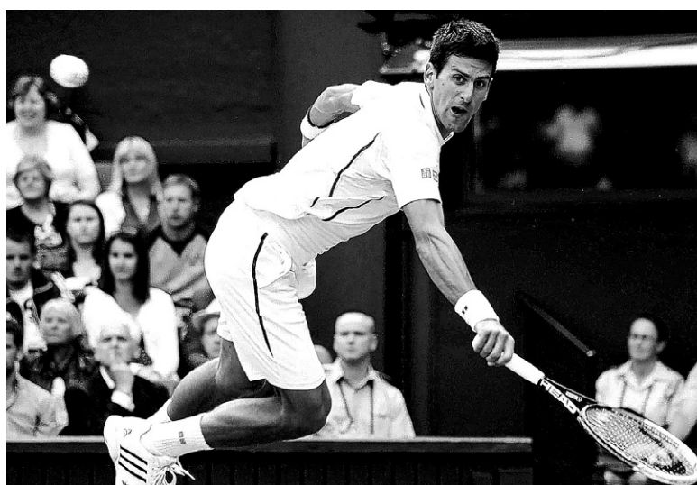
남자 테니스 세계랭킹 1위인 노박 조코비치는 영국 워블던 올잉글랜드클럽(All England Club)에서 진행되는 '2013 워블던 테니스 남자 개인전'의 바쁜일정 속에서도 사찰을 찾았다.