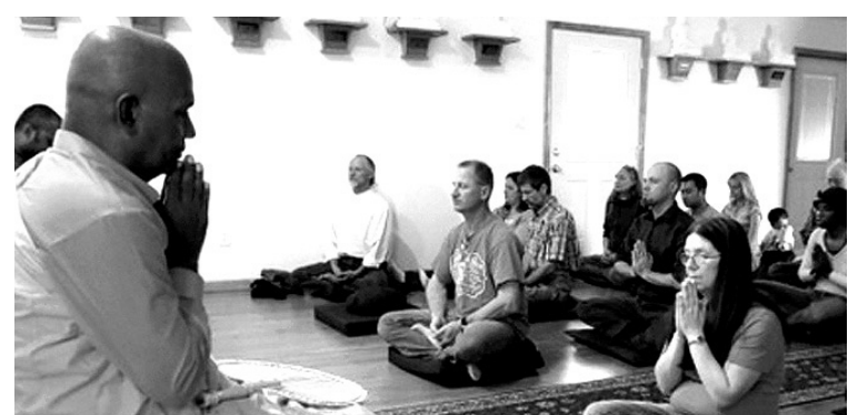
10년 전 스리랑카 이민자를 위해 세워졌던 스리랑카 불교사원은 현재 미국 현지인과 외국인들이 찾는 사찰로 변모했다.