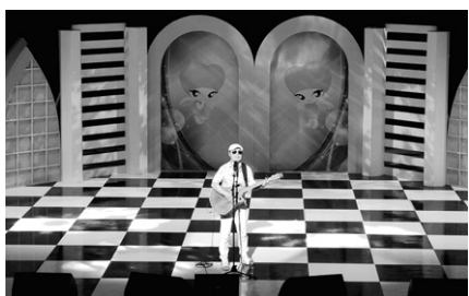
6월 28일 열린 콘서트 장면

백혈병 소아암으로 힘들어하는 어린이들을 위한 희망의 음악회가 열렸다. (사)생명나눔실천 광주전남본부(본부장 현지)는 지난 6월 28일 광주빛고을문화회관에서 ‘난치성 소아암 백혈병 아이들을 위한 생명나눔 콘서트 6’을 개최했다.