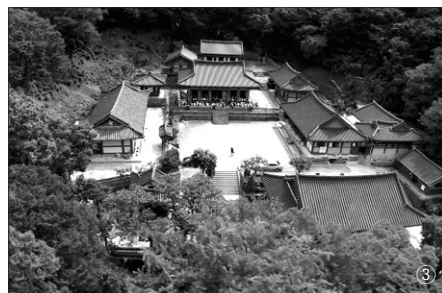
왼쪽 위부터 ①무등현대미술관, ②의재미술관, ③문빈정사, ④증심사.