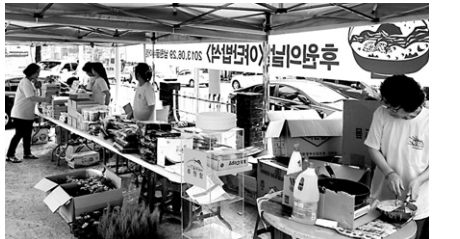
후원의 날에는 친환경 농산물 판매 등이 진행됐다.

불교환경을 일반시민들에게 알리는 환경법회와 빈그릇운동, 광주전남지역 시민사회단체활동가 자비의 쌀 나누기, 518묘역 음악회 등을 정기적으로 개최하고 있