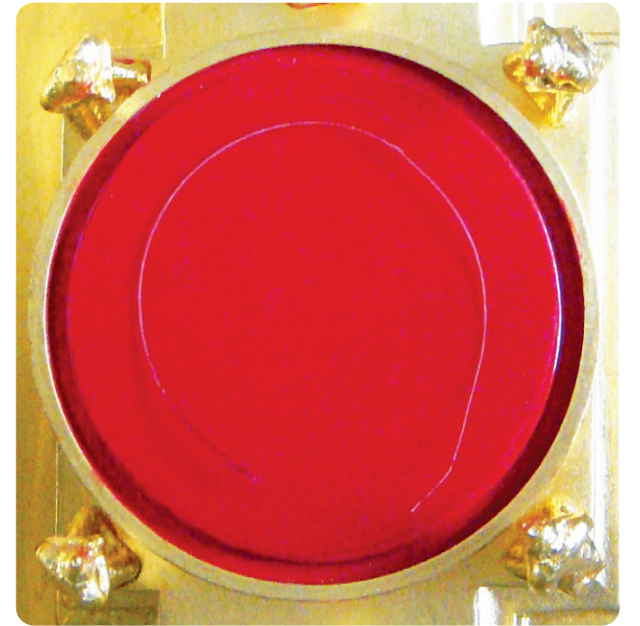
▶ 6월 14일 : 2500여년 만에 나투신 성스러운 부처님 성발사리