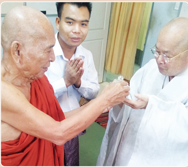
▶ 6월 14일 : 부처님 성발사리 이운 (종정 우 꾸마라)