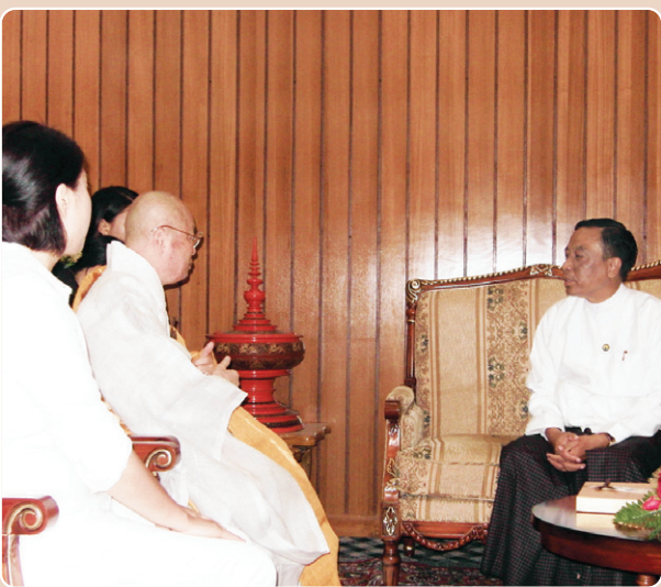
▶ 6월 12일 : 네피도 관광부청사에서 장관 (U HTAY AUNG)미팅