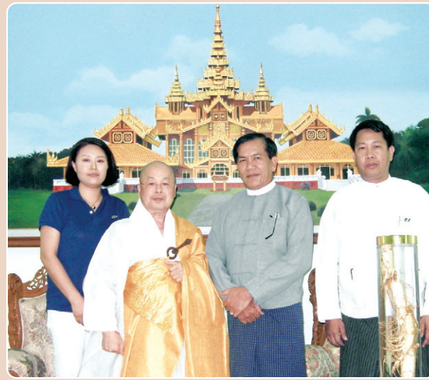
▶ 6월 13일 : 바고 종교성 총리 면담 (총리실)