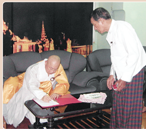
▶ 6월 13일 : 웨모도 파고다 접견실