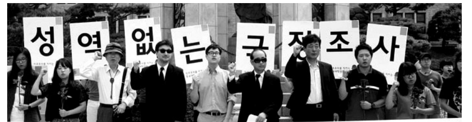
동국대 시국선언 교수 51명과 동국대 45기 총학생회 및 동문회는 동국대 불상 앞에서 국정원 불법선거 개입을 규탄하는 기자회견을 열었다.