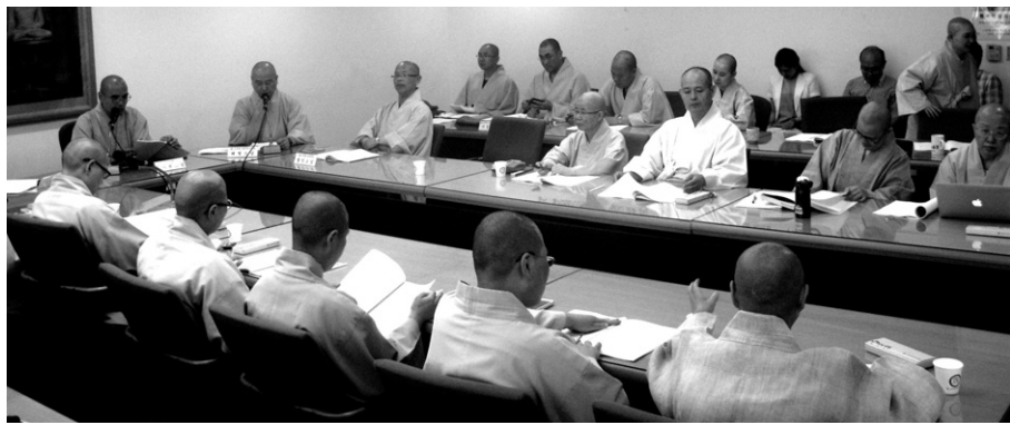
조계종 교육원은 6월 22일 교수 아사리 1차 포럼을 개최했다.

로 대처승과의 변별력을 통해 위상을 강화해야 한다”며 “소속원을 분명히 하는 단체 복으로서 승복에 대한 변화가 불가피하다”고 제안했다.