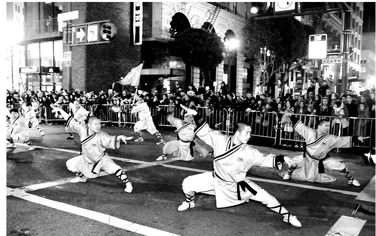
소림사 스님들이 미국 거리에서 쿵푸를 시연하고 있다.