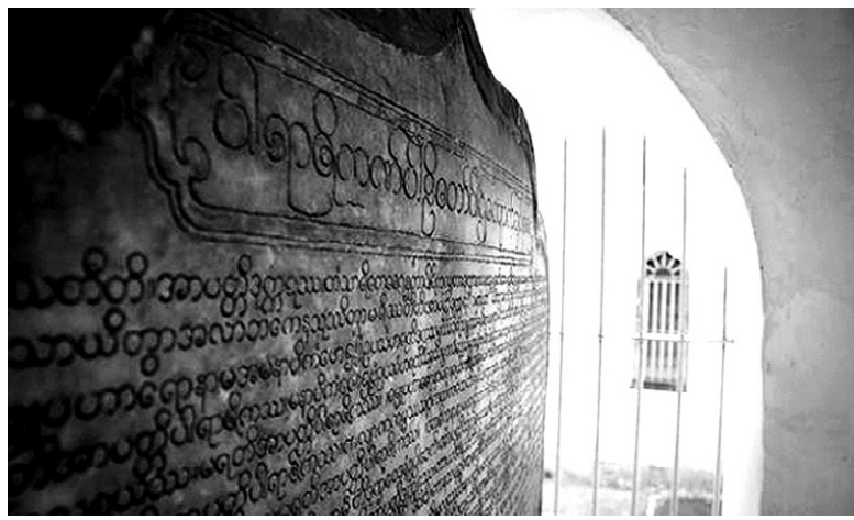
미얀마 만달레이의 미하 로카마라자인(Maha Lawkamarazain). 1868년 729개의 돌에 새긴 이 석경은 현재 쿠토도 탑 주변에 봉안되어 있다.

요하다. 해당 기록물의 소멸·약화 권역에 지대한 영향을 미친 것이어 가 인류 유산을 빈곤하게 만드는 데 불가한 유산으로서, 특정 문화