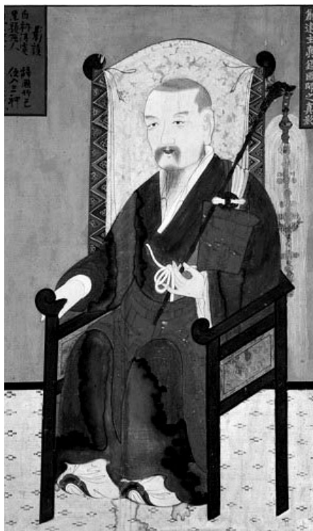
진감 선사 진영