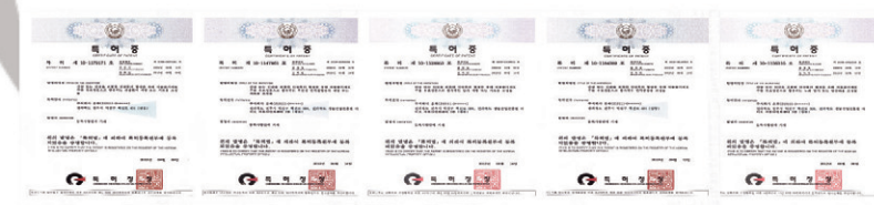
▲ 산삼배양세포의 유효성을 검증한 결과 항산화, 면역증강, 항노화, 간 보호 등의 유효 활성기능이 확인되었으며 특허로 등록되었다

게재된 바 있는 이 기술을 동양의 신비로 불리는 강원도산 50년근 산삼에 접목한 것이다. 그결과 산삼의 줄기세포인 '산삼 배양세포'에서 우리 몸을 회복시키는 획기적인 신규물질이 다량 발견된 것이다. 국·내외의 유수의 대학 및 연구기관들과 공동으로 이 산삼배양 세포의 유효성을 검증한 결과 항산화, 면역증강, 항노화, 간보호 등의 유효활성 기능이 확인되었으며 특허로 등록되었다.