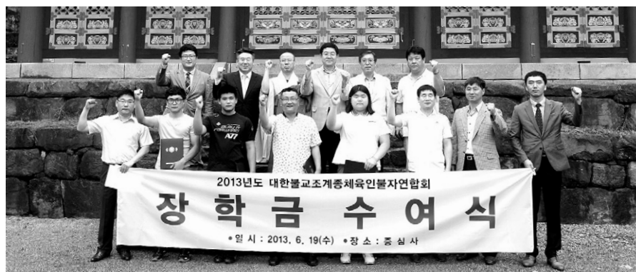
조계종 체육인복지연합회는 6월 19일 광주 증심사에서 불자체육인을 위한 장학금을 전달했다.