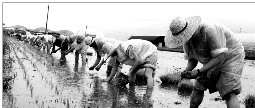
비가 오는 와중에도 화엄사 스님들이 우의를 입고 모심기에 열중하고 있다.

"한들 한들 정성을 다한 이 쌀이 굶주린 북한 주민들에게 힘이 되고 또 남북통일의 씨앗이 되길 바랍니다."