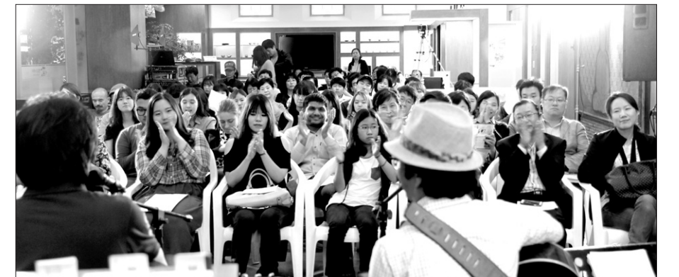
토크콘서트는 대불청이 지난 4·5월 템플스테이 통합정보센터에서 선보인 토크콘서트와 같은 형태로, 6월 27일 같은 곳에서 열린다. 사진은 5월에 열린 공연 모습.

'20대 청년강좌-신바람 나는 청춘'은 6회의 강좌로 진행되는 프로그램이다. 하중강 노동과 꿈 대표는 7월 1·8일 오후 7시 '노동과 꿈에 대한 희망의 메시지'를 주제로, 김미선 에듀머니 공공 사업 총괄 본부장은 15일 오후 7시 '돈이 많아 행복하다는 믿음은 유죄'를 주제로, 작곡가 김현성은 7월 20일 오후 1시 '뮤지션 김현성의 삶 이야기, 그리고 함께 부르는 희망의 노래' '궁정혁명'을 통한 삶의 새로운 에너지 찾기'를 주제로, 이재목 연애컨설턴트는 7월 22일 오후 7시 '돈이 없어 연애, 결혼, 출산을 포기한다? 도대체 왜?'를 주제로 템플스테이통합정보센터 3층 교육장에서