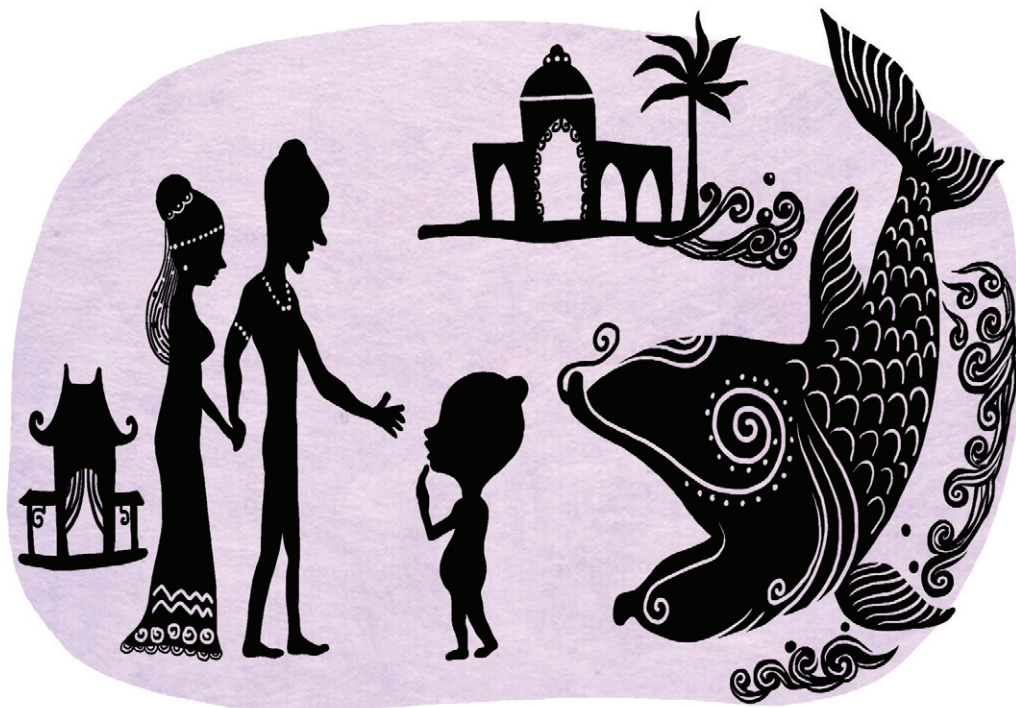
삽화 · 강병호

“잘 왔다.” 그러자 아들의 머리카락이 저절로 떨어지면서 바로 사문이 되었으니, 이름은 중성이라고 했다. 부처님께서 그를 위해 설법하시자 모든 괴로움이 다 없어지고 아라한이 되었다. 다시 부처님께서 말씀하셨다. “과거의 오랜 옛날에 불세존께서 계셨는데, 명호는 비바시불이었다. 대중들을 모아 그들을 위하여 미묘한 법을 말씀하셨다. 어느 날, 장자 하나가 그 모일에 와서 큰 법문과 보시와 지계의 복을 말씀하시는 것을 듣고 믿음과 공경의 마음을 내게 되었다.”