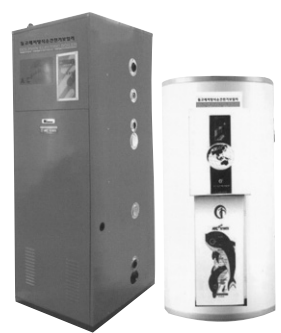
국내특허 제0751485호 세계특허출원 PCT/KR2007/006534