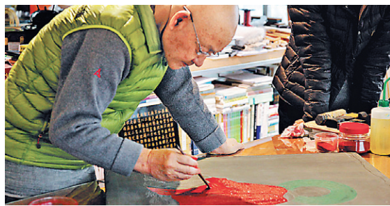
스님의 불화작업 장면.

스님의 수많은 업적 중에 빼놓을 수 없는 불사가 또 하나 있다. 바로 홀로 구운 삼천불상과 팔만대장경의 앞뒤판을 분리 제작해 16만도자대장경을 10년에 걸쳐 완성한 것이다. 이중에서도 16만 도자대장경의 완성은 가히 그 공력에 감탄하지 않을 수 없다. 팔만대장경 원본을 실크스크린으로 따서 세라믹으로 구워냈는데 양면으로 되어 있는 대장경의 앞뒤를 다 따오니 정확히 16만484장이 된다. 가로 50cm 세로 26cm, 두께가 2cm 가까운 판형을 고열로 구워내었다고 하니 그 정성과 공력은 참으로 감탄하지 않을 수 없다. 이를 위