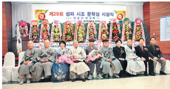
제29회 성파시조문학상 기념촬영.

해 국내 세라믹 회사들을 두루 다니며 실험을 거듭했고 전기로 제작도 직접 했다고 한다. 그리고 10년 동안 심혈을 기울여 이를 완성해 낸 것이다.