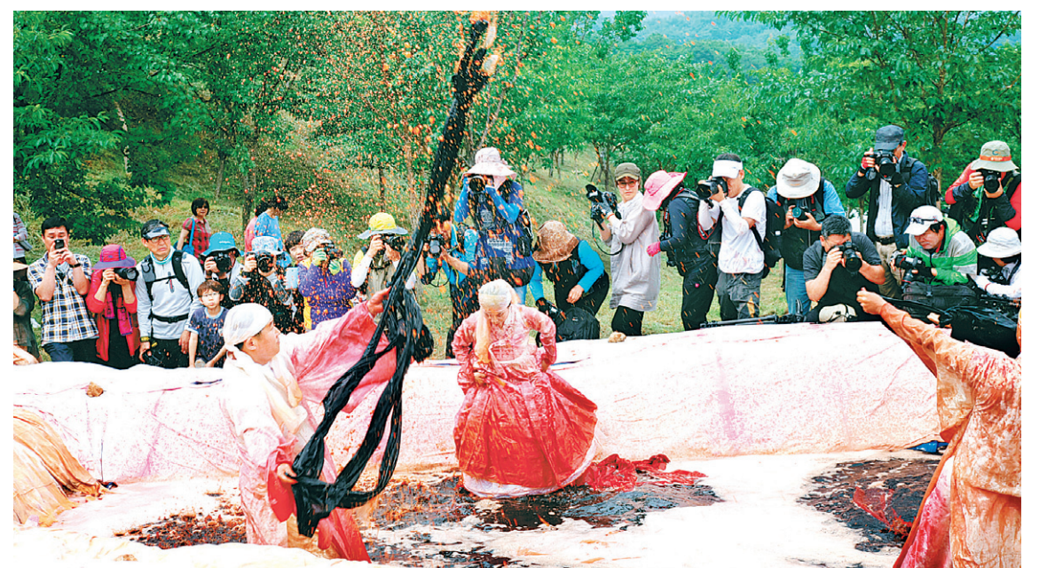
제2회 하늘꽃 천연염색 축제가 지난 6월 8일~9일 서운암 경내에서 열렸다. 화엄의 세계를 표현한 퍼포먼스 장면.

MAHA SADDHAMMA JOTIKAD HAJA SANGGALAJA 추진 집행위원장 大僧正 木鐸 - 慧恩 전화 02)733-5665, 5670, 011-229-6061 / 팩스 02)733-5671