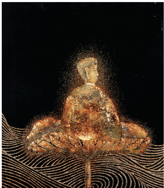
꽃으로 작업한 선화 '무유공포(無有恐怖)'