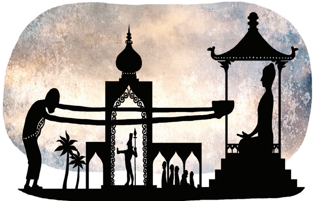
삽화 · 강병호

부처님께서 말씀하셨다. “배움이란 반드시 많이 알아야 하는 것이 아니요. 알고 있는 것을 실천하는 것이 더 중요한 것입니다. 현자 반특은 한 계승의 이치만을 알지만, 그 정밀한 이치에 정신을 몰입하고, 몸과 입과 뜻을 고요히 하여 마치 천금같이 했습니다. 사람이 비록 많이 배웠다고 하더라도 행하지 않는다면 한갓 의식과 생각만을 얻을 뿐이니, 무슨 이익이 있겠습니까?”