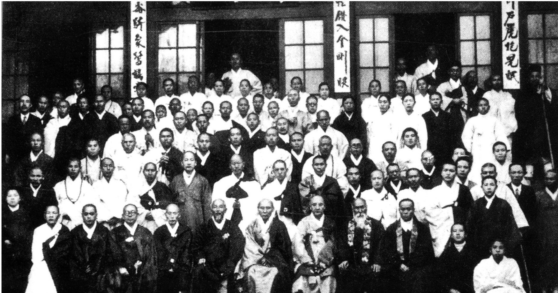
1931년 3월 23일 선학원 큰방에서 개최된 제1차 전선수좌대회(全鮮首座大會)

무엇보다도 주목할 것은 인계 즉시 선학원의 대방(大房)을 거쳐서 하고 이탄옹 스님이 입승(入繩)을 맡아 20여 명의 남자와 신도들이 참선(參禪)을 시작한 것은 선학원 창설의 취지를 반영하는 상징적인 움직임이었다. 이듬해인 1932년에는 대방을 비롯한 각 방의 도배를 새로 하고 온돌을 보수하여 수행환경을 향상시켰다. 더욱이 이 해 3월 1일에는 70여 명을 회원으로 한 남녀선우회(男女禪友會)가 조직되었고, 3월 21일에는 부인선우회(婦人禪友會)가 총회를 개최하였다. 이 두 조직은 선의 대중화를 통해 선종을 진작시키기 위한 구체적인 행보였다. 이 가운데 부인선우회는 1931년 3월 21일 창립총회를 개최하고 고승법회를 통해 선 수행을 비롯한 교학(敎學)에 대한 이해도 높여갔다. 특히 1932년 11월에는 그해 9월 만주사변 발발로 피해를 입은 만주지역 동포를 구제하기 위해 현금과 의복을 모아 보내기도 하였다. 이 부인선우회는 체계적인 실행단체인 거점 선학원이 재