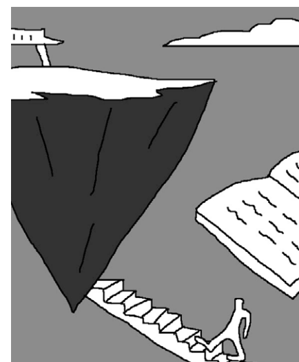
그림 · 박구원

“첫째는 부모님께 효도하고 스승을 받들어 모시고, 자비로운 마음으로 목숨을 죽이지 않으며 열가지 선업을 닦는다. 둘째는 삼귀의를 받아 지니고 모든 계율을 갖추며 위의(威儀)를 범하지 않는다. 셋째, 도를 향하는 마음을 발하고 인과의 법칙을 깊이 믿으며, 대승경전을 읽으면서 수행자들에게 권진(勸進, 정진하기를 권함)한다.”