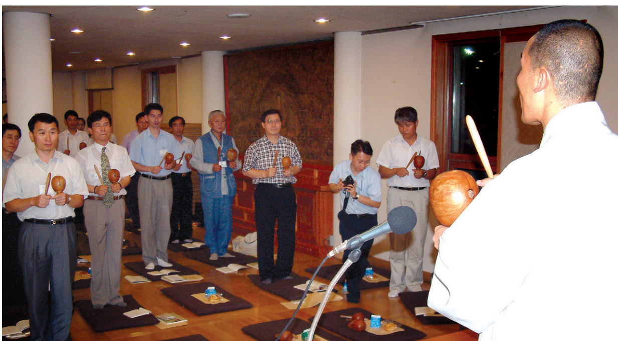
2002년 열린 목탁의식 집전 교육모습. 시대에 맞는 의식 개발과 보급이 필요하다는 목소리가 높다.

이처럼 불교의례는 종교의례를 넘어 민족문화와 정신향양에 기여할 수 있다. 결국 근대화를 위한 의례개혁에도 전통의례의 중요성은 더욱 높아지는 것이다. 의례개혁은 전통의례가 가진 원형의 가치를 인정한 바탕 위에 새로운 시대에 맞는 의례를 창안하는