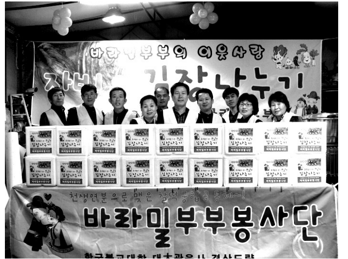
매년 연등회에 참가하는 법안정사 부부불자회(사진 왼쪽). 한국불교대학 대관음사 '바라밀부부회'는 봉사단을 조직해 연말마다 경로잔치를 열고 홀로 사는 어르신들을 위해 '자비의 김치 나누기'를 실시하고 있다.

법안정사, 홈페이지로 운영 체계화 해원정사, 부부가 함께 신행활동 대관음사, 남편·아내위한 발원문