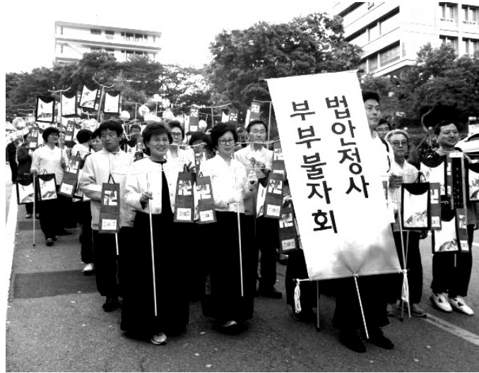
매년 연등회에 참가하는 법안정사 부부불자회(사진 왼쪽). 한국불교대학 대관음사 '바라밀부부회'는 봉사단을 조직해 연말마다 경로잔치를 열고 홀로 사는 어르신들을 위해 '자비의 김치 나누기'를 실시하고 있다.

홈페이지(www.buban.org)에 △교육분과 △봉사분과 △상상분과 등 계사판을 체