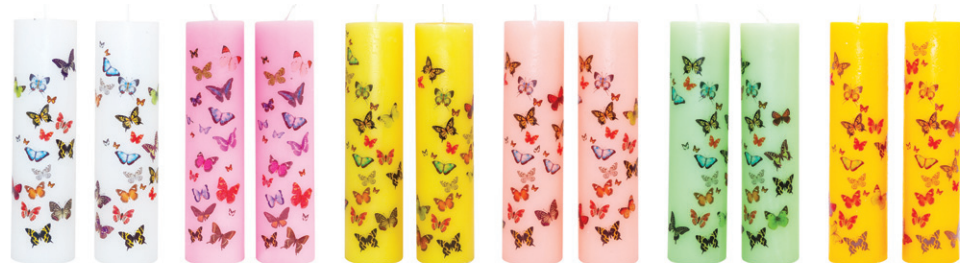
나비양초 - 화이트 / 핑크 / 옐로우 / 살구 / 그린 / 개나리 (7.4 x 29cm)