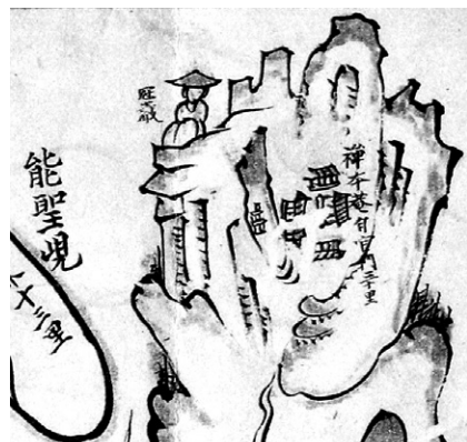
<하양현지도>에서 선본사 고지도 부분. 갓바위 부처님이 삿갓을 쓴것으로 표현돼 있다.