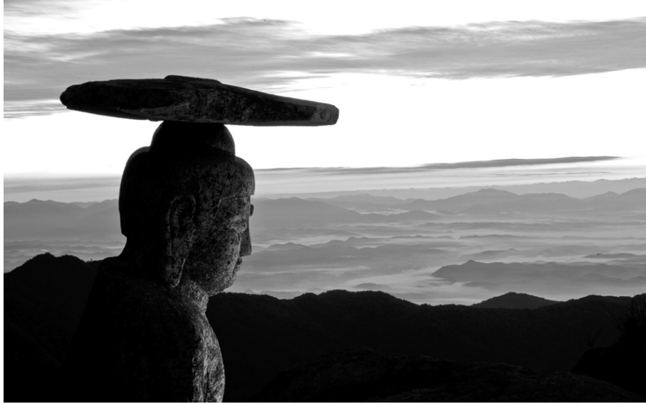
세미나와 함께 열리는 동아시아 약사신앙 사진전의 대상 수상작 ‘자비의 눈빛’.