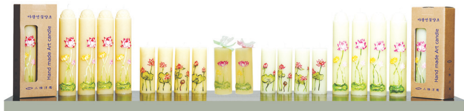
수공예예술양초 - 밀납 / 약삭아광연봉연꽃양초 / 약삭1호예술연꽃양초 / 아광 연꽃초