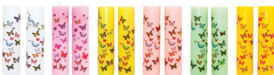
나비양초 - 화이트 / 핑크 / 옐로우 / 살구 / 그린 / 개나리 (7.4×29cm)