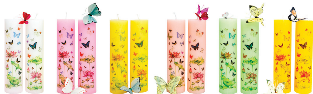
연꽃나비양초 - 화이트 / 핑크 / 옐로우 / 살구 / 그린 / 개나리 (7.4×29cm)

삼환양초에서는 법당에서 부처님께 초 공양을 쉽게 올릴 수 있도록 연꽃 모양의 크리스탈 받침대와 밀납양초로 손쉽게 양초를 교체할 수 있는 신제품을 개발하였습니다. 밀납양초는 특수 PC 컵을 이용하여 화재위험을 완벽하게 방지하도록 설계되어 있어 법당 및 야외 어디서나 안전하게 초 공양을 올릴 수 있습니다. 이제 모든 불자님들의 마음을 담아 법당에서 1인1등 연꽃밀납양초로 초 장엄을 할 수 있습니다.