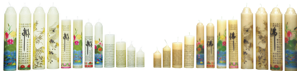
한복밀납양초 - 4호 / 3호 / 2호 / 1호 / 밀대전사자 / 돈대전사자 / 원기동전사자