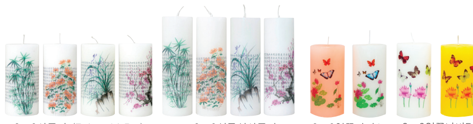
3×6사군자 (7.4×14.5cm) 3×6식물성사군자 3×6연꽃나비A 3×6연꽃나비B