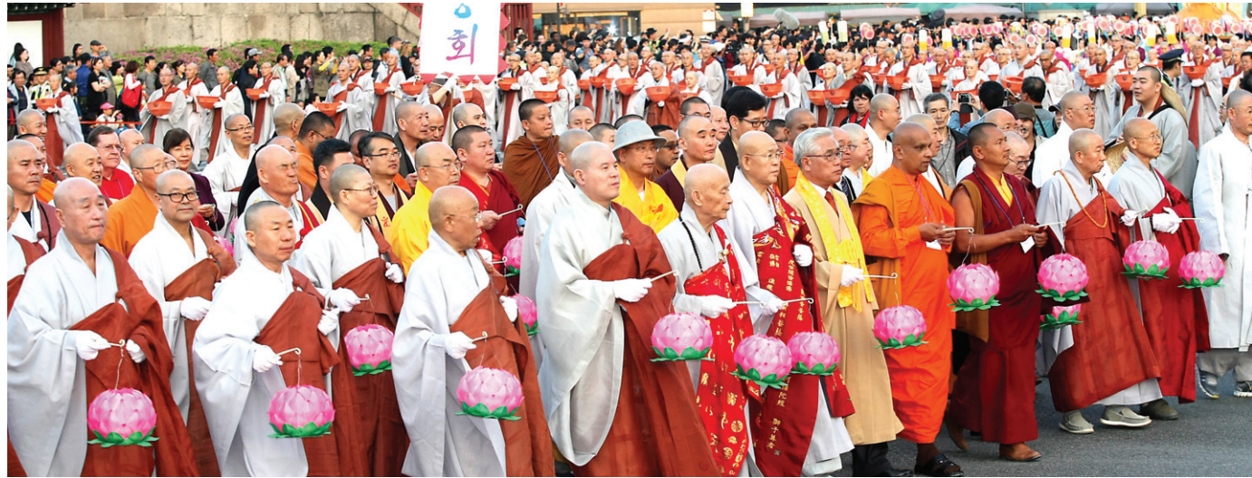
불기 2557년 부처님오신날 연등회에서 주요내외빈이 제등행렬에 동참하고 있다.

불기2557년 부처님오신날을 봉축하기 위한 연등회 연등축제가 5월 11일부터 12일 까지 서울 종로와 조계사 일대에서 열렸다. 중요무형문화재 제122호로 지정이후 2번째로 열린 연등회는 이제는 한국을 대표하는 문화축제로 명실 상부하게 자리잡았다. 부처님오신날 봉축위원회(위원장 자승, 이하 봉축위)의 집계에 따르면 올해 연등회를 찾은 내·외국인은 약 30만 명으로 이중 외국인인 3만 5천명이 참석했다. 남북관계 악화로 외국인 참가가 저조할 것으로 예상됐지만, 평년 수준을 유지했다는 게 봉축위의 설명이다.