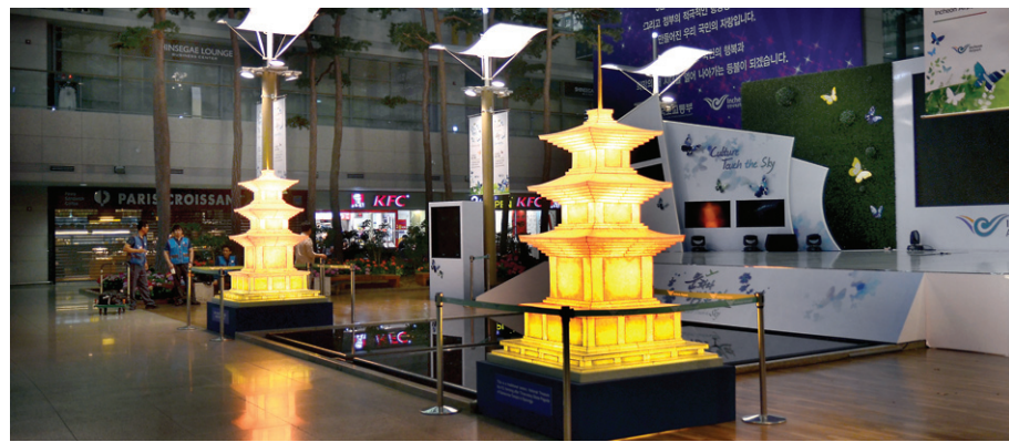
인천국제공항 밀레니엄홀에 설치된 연등회 전통등 '감은사지 삼층석탑 등'. 5월 17~23일까지 불을 밝힌다.

'종교시설물 NO' 입장에 백기 조계사 15일 항의 법회 등 성토 잇달아... 장엄등 허용