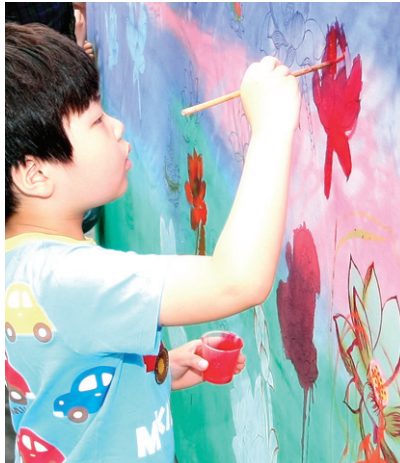
12일 열린 전통문화마당에서 어린이가 연꽃 채색 체험을 하고있다.

'연등회 서포터즈'의 활약이 두드러졌다. 지난 4월 3일 대한불교청년회의 주최로 발족한 서포터즈에는 한국을 포함해 미국, 독일, 프랑스, 베트남 등 20개 국가에서 온 76명의 젊은이들이 참여했다. 그간 언어 통역 문제가 지속적으로 제기돼 왔던 만큼 이번 서포터즈는 다양한 연등회 참가자들과의 소통을 해결할 수 있는