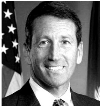
(사진 왼쪽 위부터 시계방향으로)마크 샌포드(Mark Sanford) 하원의원, 팀 라이언(Tim Ryan) 하원의원, 미디어 거물 루퍼트 머독(Rupert Murdoch), 영화감독 데이빗 린치(David Lynch), CNN 앵커 캔디 크로울리(Candy Crowley), 영화배우 러셀 브랜드(Russell Brand), 오프라 윈프리(Oprah Winfrey).

또한 허핑턴포스트는 "명상은 '탐냄과 혐오와 우둔함으로 가득한 이 세계를 어떻게 극복할 수 있을까' 하는 것을 목표로 한