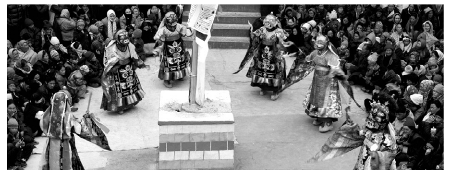
파드마삼바바의 탄생을 기리는 헤미스 축제.

인도 북부 라다크에서 6월 18~19일 '헤미스 축제(Hemis Festival)'가 개최된다.