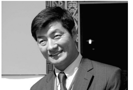
롬상 상하이 티베트 망명정부 총리

까지 티베트의 정신적 지도자인 달라이 라마의 대리인과 9차례에 걸쳐 협상을 진행했지만, 성과를 내지 못한 채 대화가 중단됐다.