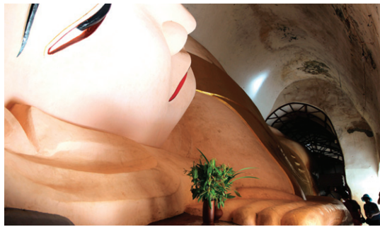
버강에 위치한 마누하 사원의 거대한 와불상.