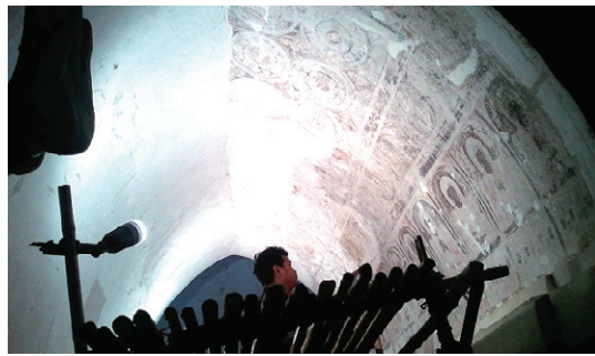
아난다 사원에서의 보수작업 모습