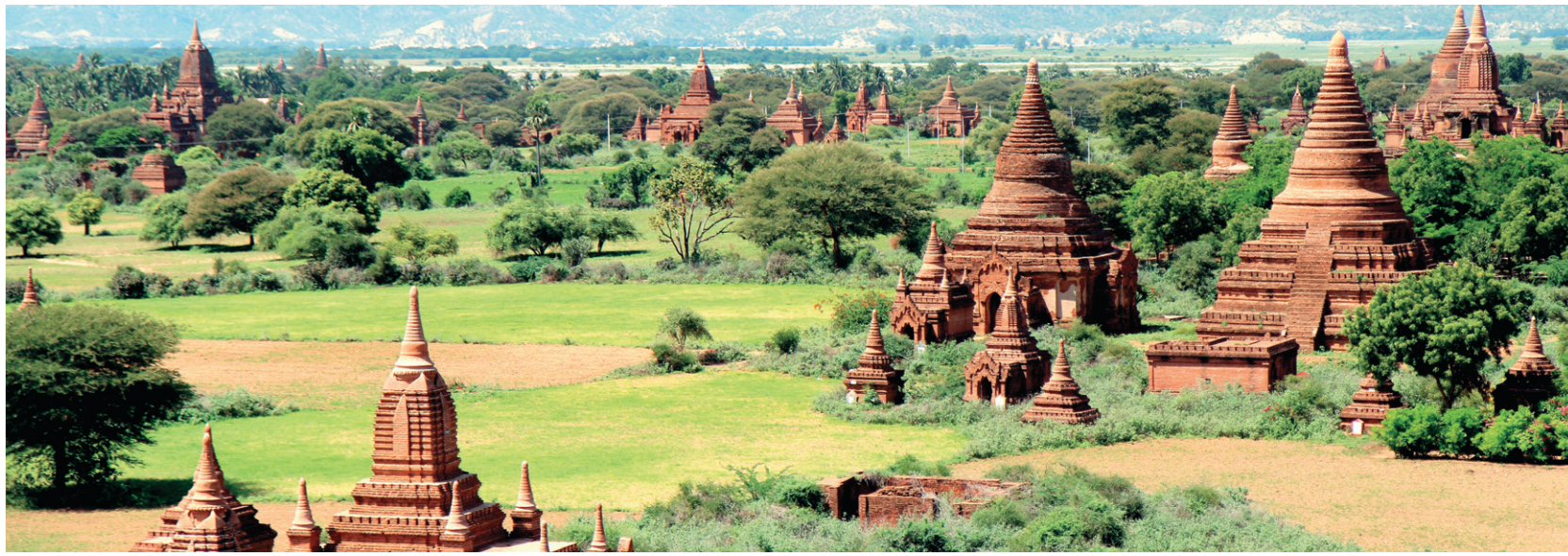
버강은 '파고다의 도시'로 알려질 만큼 수많은 불탑들이 있다. 버강은 캄보디아 앙코르와트, 인도네시아 보로부르드 사원과 함께 세계 3대 불교유적지로 꼽힌다. 버강 왕조 당시 상좌불교가 중흥하며 미얀마에 자리 잡았다.