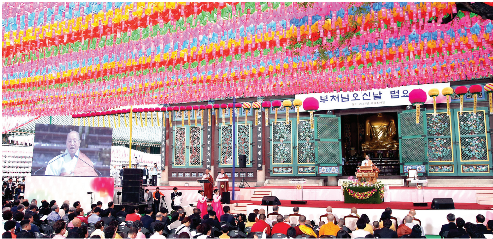
조계종(총무원장 자승)은 서울 종로 조계사에서 불기 2557년 봉축 법요식을 열고 부처님이 세상에 오신 뜻을 기렸다. 사부대중 3천여명이 참석한 이날 법요식에서는 청소 노동자, 외국인 노동자, 난민 외국인 일부 등이 나서 헌화와 헌축을 해 이웃의 의미를 더 했다. 총무원장 자승 스님도 봉축사를 통해 이웃과 함께 하는 불교로 거듭날 것을 강조했다.