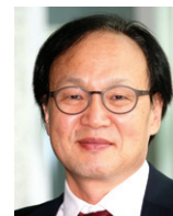
(시인, 불교평론 편집인)

부처님 오신 날 밤 조계사로 봉축 꽃등 달러 가네 붉은 등 노란 등 파란 등 하얀 등 가슴 설레게 환하네 구경나온 아버지 어머니 언니 오빠들이 극락 온 듯 즐거워하네 파란 눈 아가씨 코 큰 종각 곱슬머리 아저씨들은 더 좋아하네 모두모두 부처님처럼 웃네 내년에는 다리 아픈 고양이 배고픈 강아지도 함께 웃었으면 좋겠네