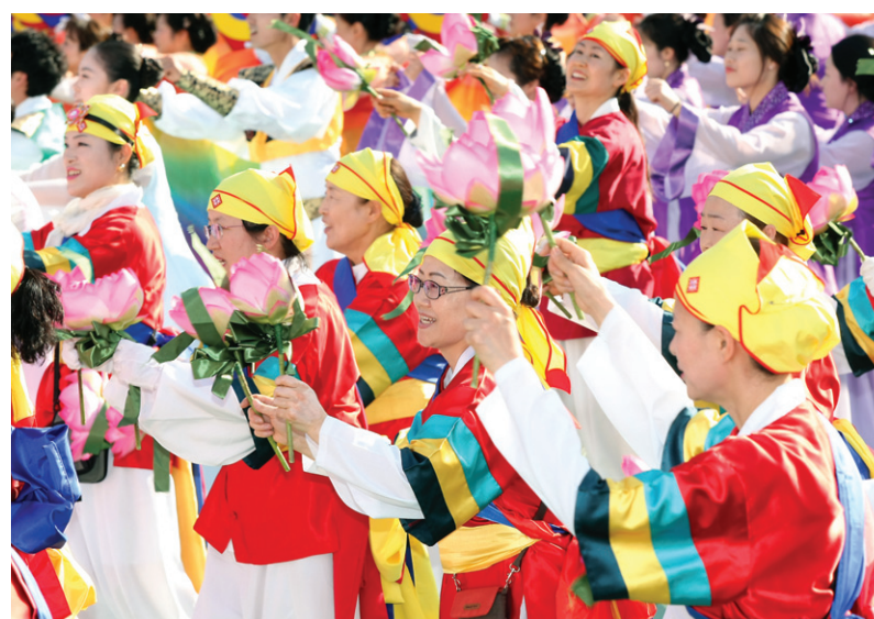
신명나게 율동에 열중하며 축제를 즐기는 불자들.