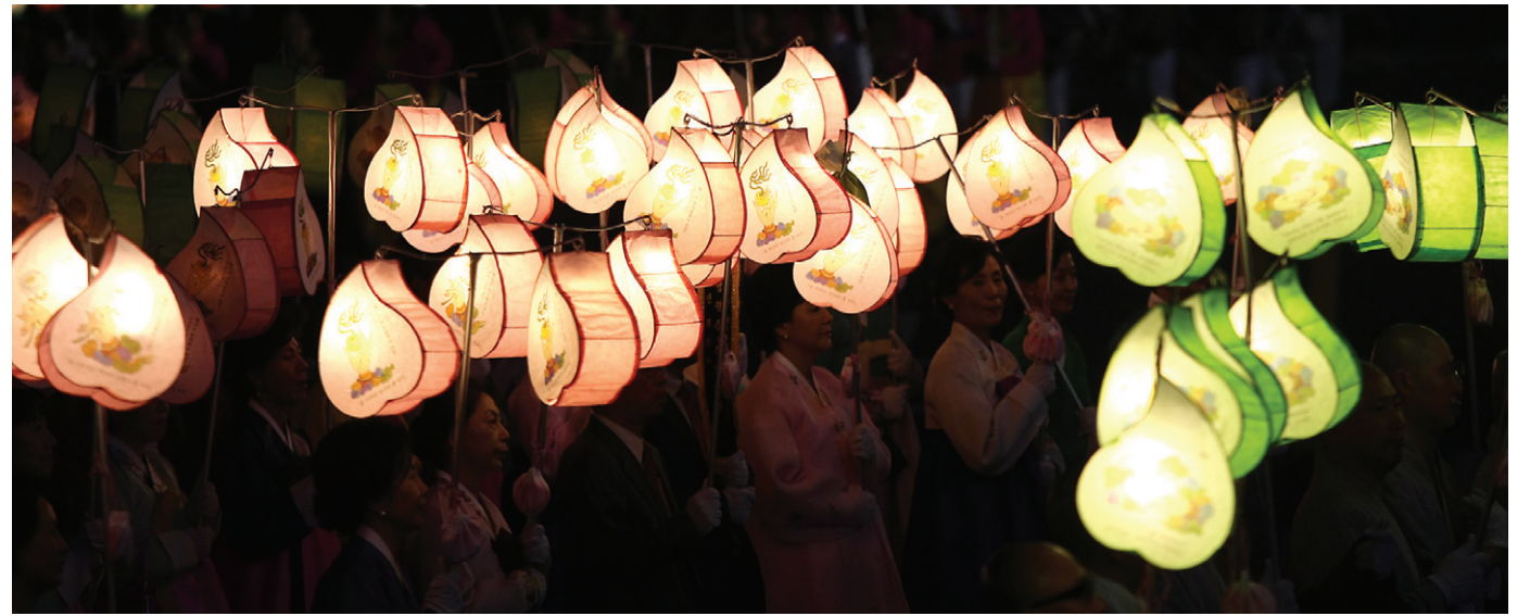
연등행렬에는 불자들이 손수 만든 형형색색의 연등이 눈길을 끌었다.