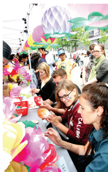
문화마당에 참가한 외국인들.