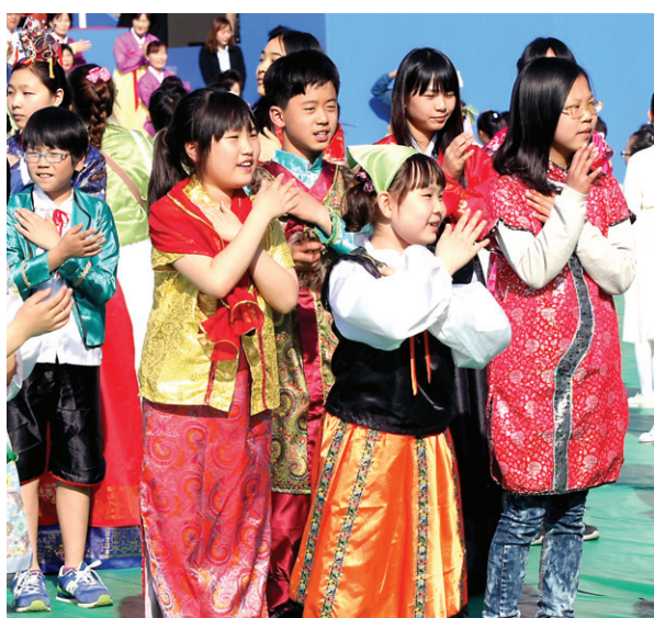
어울림한마당에 참가한 어린이들의 율동발표.