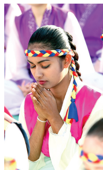
외국인 불자가 삼귀의를 모시고있다.