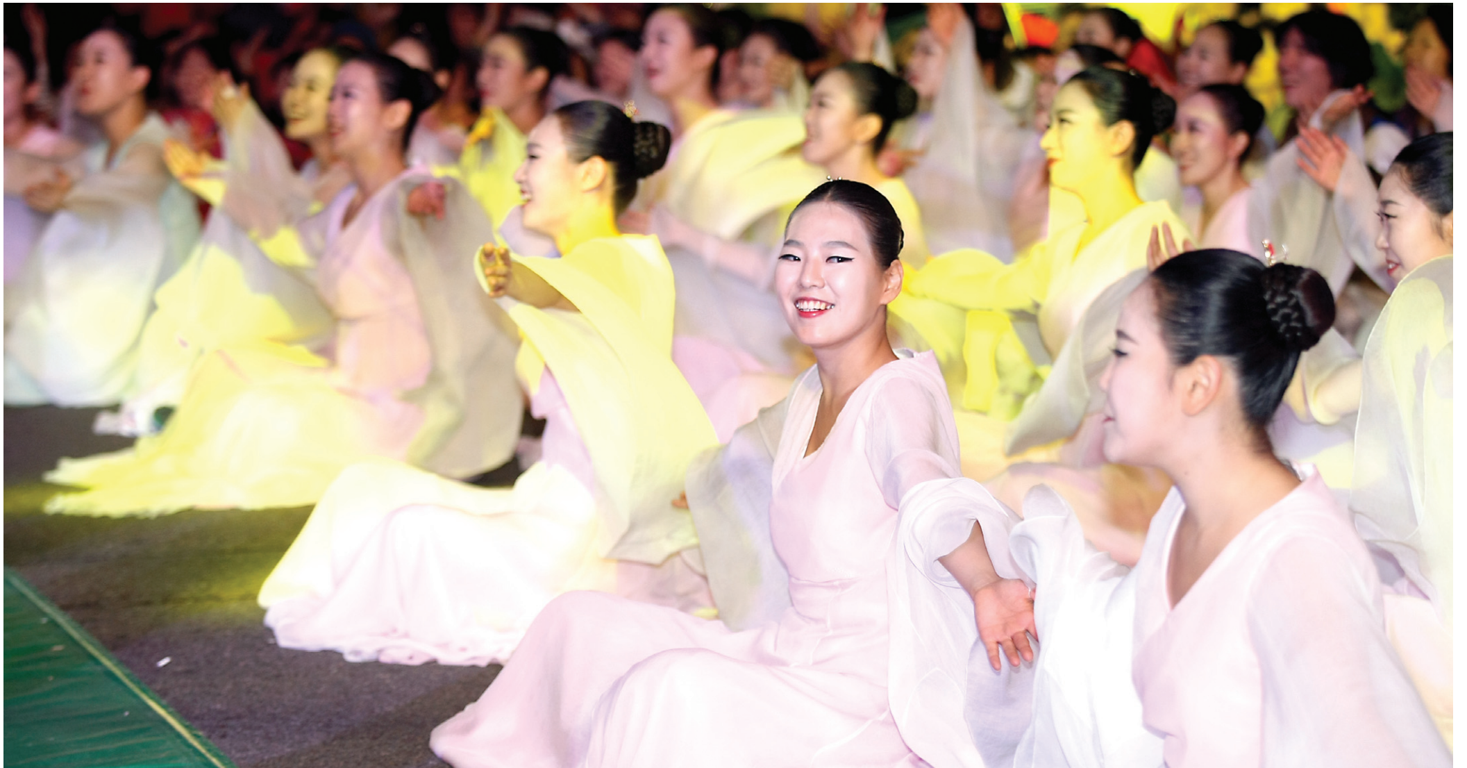
회향한마당에 참가한 한미음선원 청년회 회원들이 흥겨운 율동으로 부처님오신날의 축제를 즐기고 있다.

작은 등 하나 하나 모여 부처님오시는 길 밝히면 등 밝힌 마음에 공덕 쌓이고 쌓이네 오늘은 좋은 날 부처님오신날