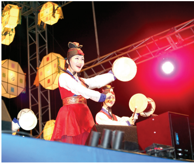
회향한마당의 국악 공연 모습.

작은 등 하나 하나 모여 부처님오시는 길 밝히면 등 밝힌 마음에 공덕 쌓이고 쌓이네 오늘은 좋은 날 부처님오신날