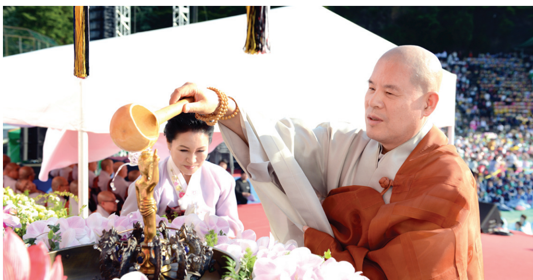
조계종 총무원장 자승 스님의 관불 모습.