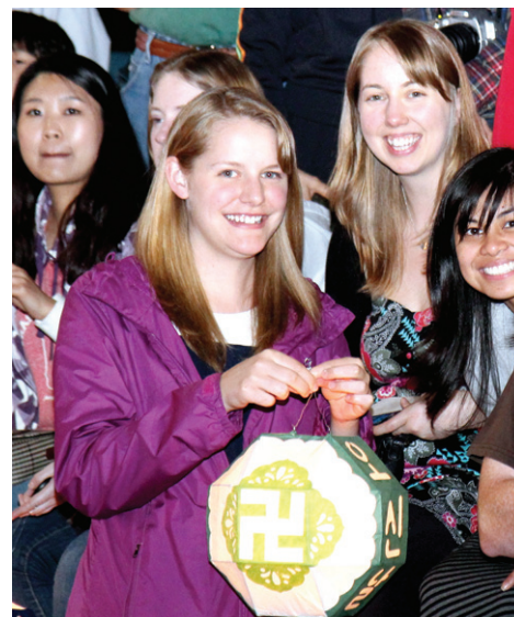
연등축제에 참가한 외국인과 불자들이 연등행렬을 지켜보며 환호하고 있다.