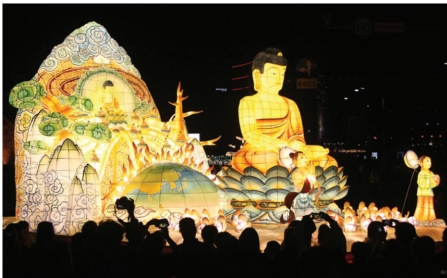
한미음선원의 부처님등과 후불탱화등.