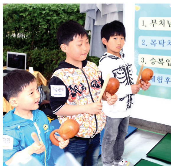
목탁치는 법을 배우고 있는 어린이들.