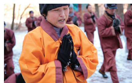
SBS 다큐 '황혼 산문에 들다'의 한 장면.

SBS=다큐 '황혼 산문에 들다' KBS=인간극장 '세 스님과...' BTN='원웅무애의...철웅대선사'