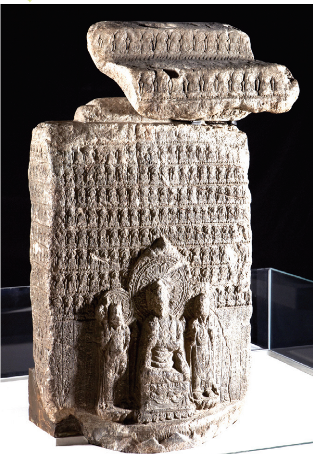
'게유'가 새겨진 삼존천불비상(국보 제108호)은 천불상을 도상적으로 표현한 첫 사례로 주목된다. 전시는 6월 23일까지.