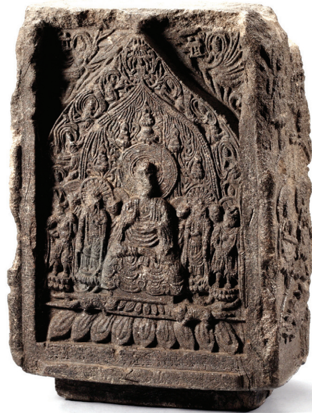
아미타불의 극락정토 장면이 그대로 묘사된 '계유명전씨아미타불상' (국보 제106호). 각면에 발원의 내용이 담겨 있다.

대부분 불비상의 존명(尊名)이 아미타불(阿彌陀佛)로 나타난 것은 당시의 사상적 배경을 엿볼 수 있게 한다. 또한 불비상에 새겨진 글자는 제작 연대 및 제작 당시의 역사적 배경까지도 이해할 수 있어 학술적 가치를 더하고 있다. (043)229-6401 정혜숙 기자