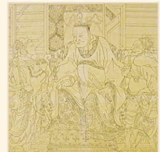
초안 (먹물 밑그림)