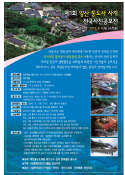
통도사 사진전 표지

통도사 산태 암자의 사계절 풍광과 신생활동에 대한 내용을 담은 사진으로 참가 자격에는 제한이 없다. 작품 규격은 11"×14"사이즈로 접수처는 (사)한국사진작가협회 양산지부에서 접수 받는다. 심사는 9월 7일 양산 통도사에서 진행될 예정이며 발표는 9월 9일이다. 시상일은