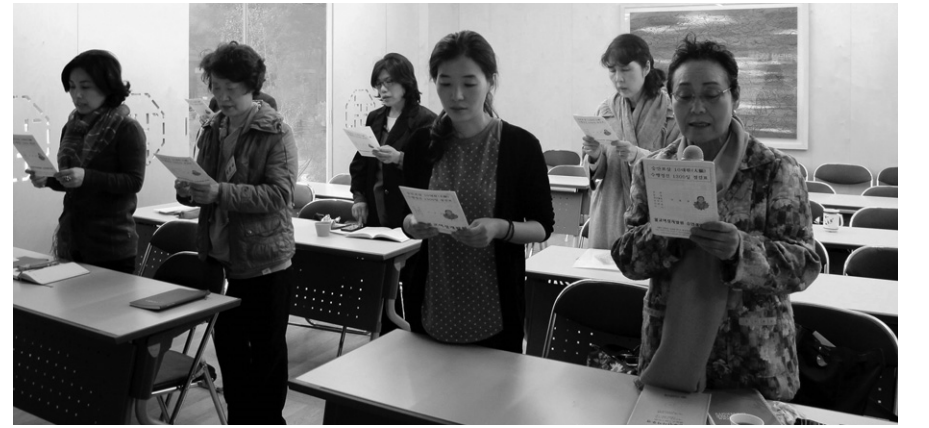
여성불자들이 모여 다양한 신행활동을 펼치고 있다. 사진은 지난 5월 7일 열린 불교여성개발원 승만경 모임 현장