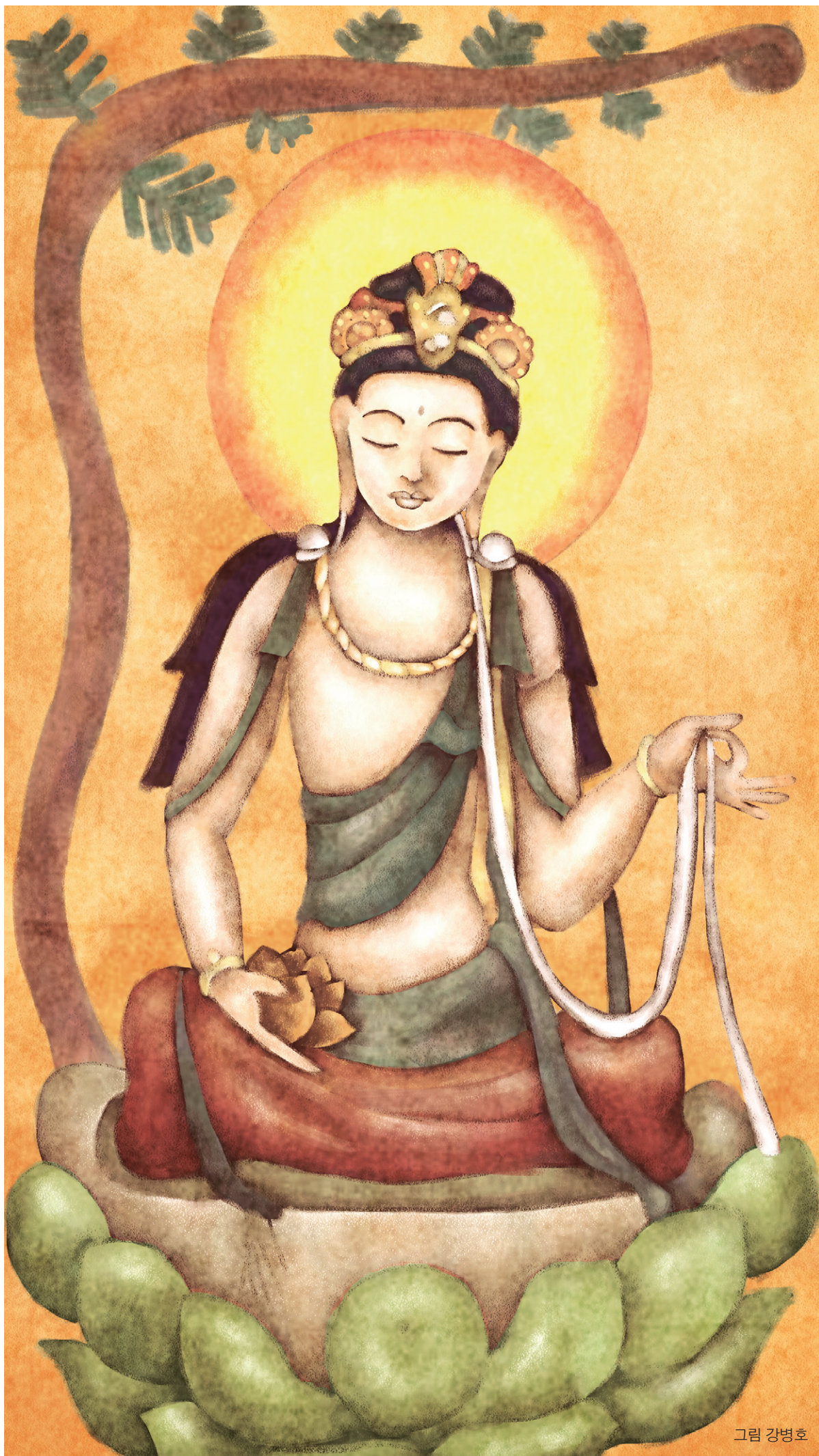
최초의 비구니 마하파자파티가 아라한과를 증득한 모습. 마하파자파티는 여성에 대한 불교의 단편 문헌을 연 첫 선지식이었다.