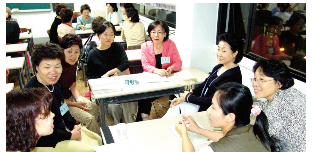
불교여성개발원의 여성리더교육 장면. 다양한 활동에도 아직까지 불교 내 양성평등의식은 사회변화에 비해 뒤쳐진다는 지적이 많다.