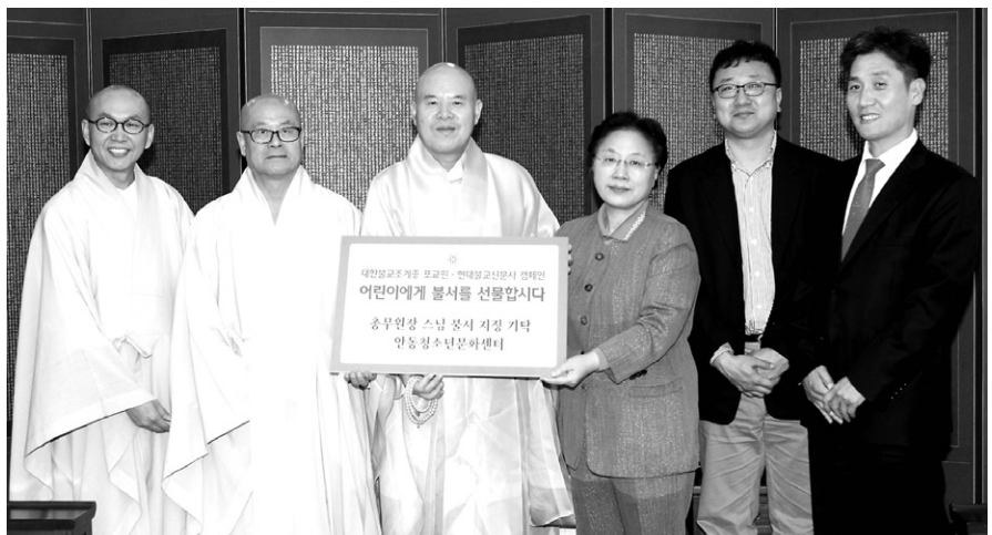
조계종총무원장 자승 스님은 5월 9일 본지와 포교원의 '부처님오신날 어린이에게 불서를 선물하자' 공동 캠페인에 동참했다.