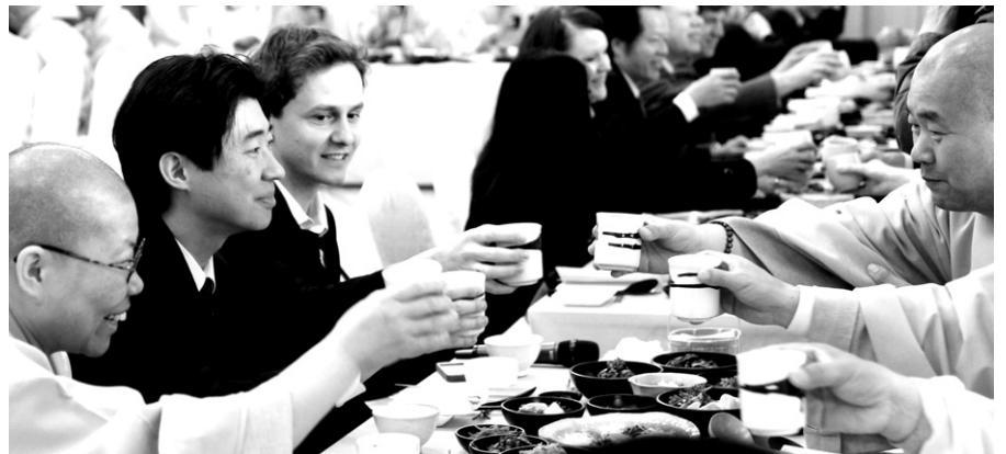
조계종 스님들과 주한외교사절들이 진관사에서 차와 사찰음식으로 만찬을 즐기고 있다.

의 희생사 모두에게 위로를 드린다"며 "이러한 안타까움을 치유하기 위해서라도 여러 국가들의 노력으로 한반도에 평화가 정착되어야 한다"고 강조했다.