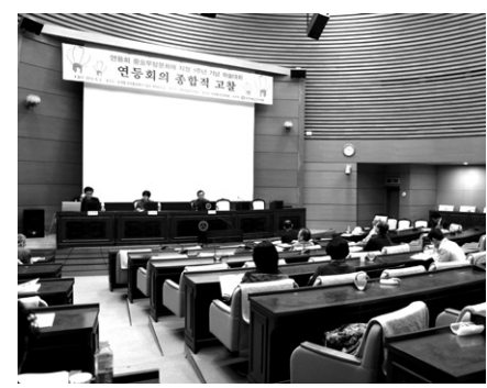
연등회 전통보다 사회통합 의미가 중요

홍 회장은 “연등회는 분명 다양한 갈등을 지닌 한국사회에 화합을 유도하는 힘이 있다”며 “전통에 치우치지 보다 오히려 전국민의 축제가 돼 그 기능을 확산시