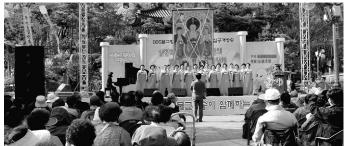
행복음악제에는 500여 대중이 운집했다.

초대 총무원장 성문 스님은 인사말을 통해 "한국불교조전종은 모두가 부처를 이룰 수 있도록 전법도생의 활로를 전개할 것"이라며 "우리 종성 모두가 빛이 되고 불교가 되는 세상을 열어가겠다"고 밝혔다. 노덕현 기자