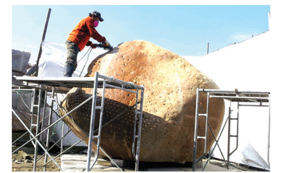
부도탑 제작팀은 경주에서 2m 60cm의 화강석을 찾아 2개월여 작업을 진행했다.

이번 부도탑을 제작하면서 좋은 가르침을 배웠다. 전장일 화백과 오채현 작가. 두 사람은 “대행 스님의 부도탑을 맡게 된 것을 영광스럽게 생각한다”며 “대행 스님과 한마음선원 사부대중의 생각을 우리는 그동안의 경험과 지식으로 이끌어 냈을 뿐”이라고 흡족해 했다.