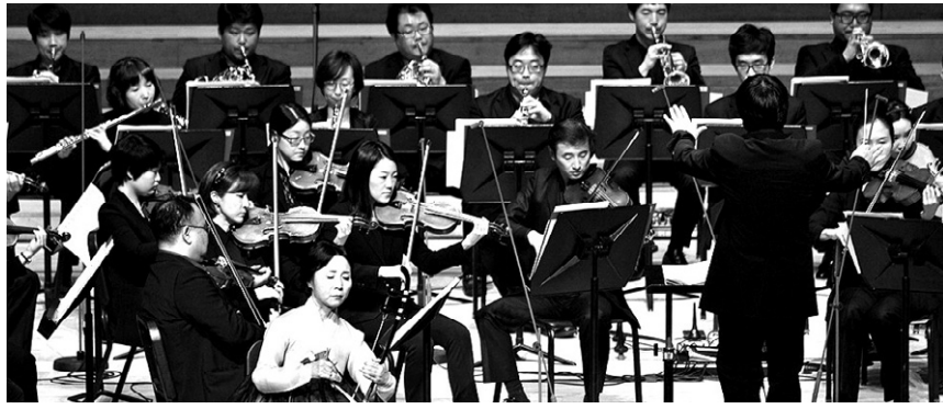
2013년 봉축을 맞아 열린 니르바나필의 음악회는 국악과 산불가, 서양음악이 어우러진 자리였다.

하여 봉축음악회를 여는 이유는 아주 간단하다. 불교가 얼마나 위대한 종교이고, 음악이 얼마나 전법(傳法)의 효과적인 수단인가를 일깨워주는데 있다. 음악이 배제된 전법은 상상할 수 없는 일인데도 현재의 한국불교는 음악, 특히 서양음악은 경시하는 정도를 넘어 거의