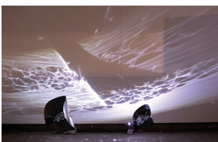
서현의 '누구라도 그러하듯이'

서현 작가의 첫개인전 '빛을 찾는 여정'이 5월 13일까지 삼청동 스페이스선+에서 열린다.