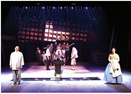
연극 '푸르른 날에' 한 장면

남산예술센터와 신시컴퍼니가 공동 제작하는 '푸르른 날에'가 오는 5월 4일~6월 2일까지 남산예술센터 무대에 다시 오른다. 푸르른날에는 2011년 남산예술센터 드라마센터에서 초연된 이후 그해 대한민국 주요 연극상을 휩쓸며 평단의 고른 호평을 얻은 바 있다.