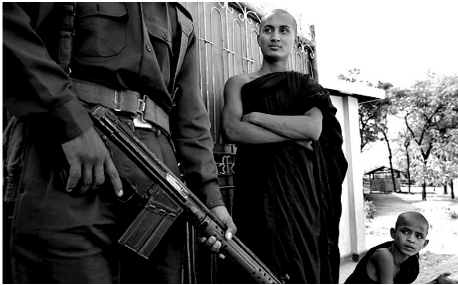
미얀마 승려를 감시하는 미얀마 군인. 불교·무슬림의 유혈 충돌로 국제사회의 우려가 커지고 있다.

ABC는 티베트의 정신적 지도자 달라이 라마의 말을 인용, “미얀마 사태는 매우 슬픈 일이며, 즉시 중단되어야 한다”고 강조하고, “부처님은 용서와 관용에 대해 가르치셨다”며 “따옴 한 구절에서 분노와 살의를 느낄 때, 부처님 가르침을 생각할 수 있어야 진정한 불제자”라고 덧붙였다.