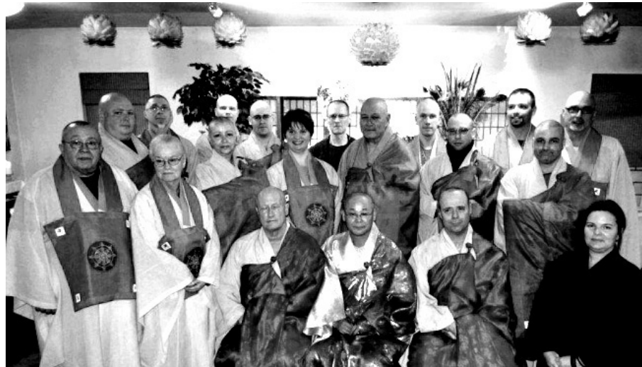
4월 12~14일 미시간 머디워터선원에서 열린 ‘미동부지역 정기수련대회’에 참가한 태고종 해외교구 사부대중.

22개 사찰과 47명의 승려 및 전법사로 구성돼 있다. 이밖에 교구 종무원(미시간)과 지방총회(캐나다) 그리고 호계원으로 구성돼 있으며 교구의 지회는 미국동부·북부·남부·중부·서부·캐나다·유럽 등 7개소에 개설돼 있다.