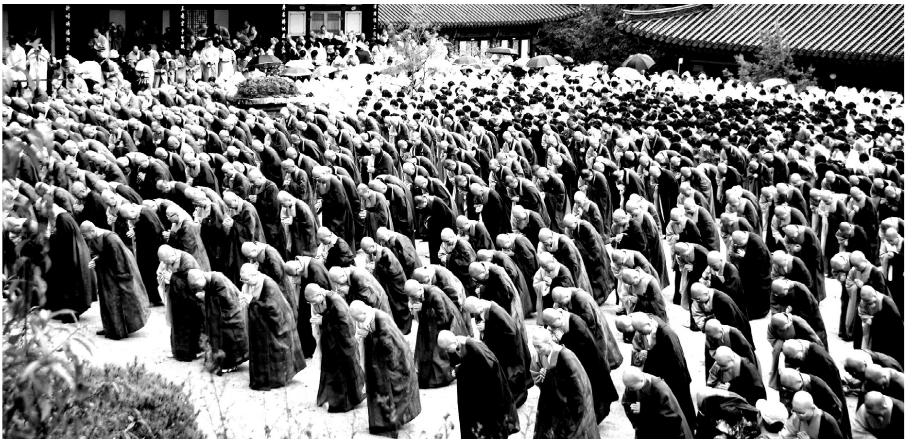
2007년 10월 19일 봉암사에서 열린 '봉암사 결수 60년 기념법회'의 모습. 승가 공동체의 수행종풍을 복원한 봉암사 결사의 정신은 이미 선학원 건립 당시부터 면면히 이어지고 있었다.