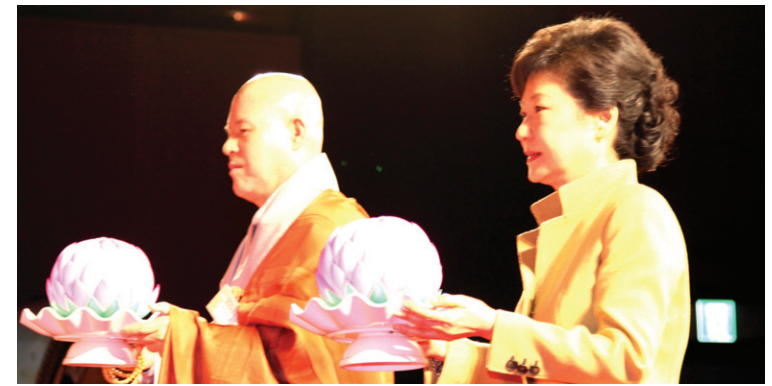
한국불교종단협의회는 4월 15일 박근혜 대통령 초청 한반도 평화와 국민 행복을 위한 기원 법회를 봉행했다.