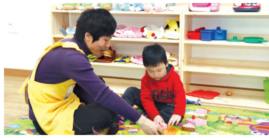
서울 정릉 적조사에 들어선 민관연대국공립 어린이집(위)과 적조사 어린이집에서 수업 중인 모습(아래).

교회이며, 4곳만이 사찰인 것으로 조사됐다. 올해에 접수된 종교단체 민관연대 어린이집도 11곳 중 10곳이 교회다. 대부분의 교회에서 어린이집을 부설로 운영하고 있는 상황에서 불교계 역시 민관연대를 통한 어린이집을 설립해야 한다는 주장이 설득력을 얻고 있다.