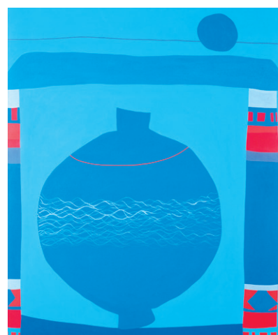
파랑바탕에 붉은 포인트가 눈길을 끄는 법관 스님 선화.

법관 스님의 선화는 먹이 아닌 빨강과 파랑의 향연이다. 왜 먹이 아닌 채색으로