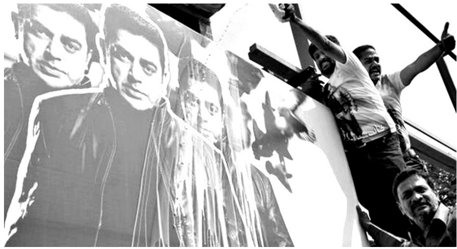
스리랑카 불교도들이 타밀계 인도인들이 만든 콜리우드(Kollywood) 영화 간판에 우유를 뿌리고 있다.

이에 앞서 지난달 19일 남인도영화노동자연맹(Film Employees Federation of South India)과 타밀나두영화감독연합회(Tamilnadu Film Directors Association)