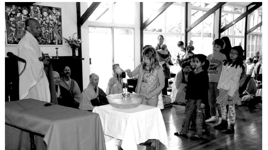
아기부터 ‘관음’ 하는 미국 어린이 관음선종 총본산인 프로비덴스 센터(총본원) 어린이 신도들이 관음식을 하고 있다. 승산 스님이 창간한 관음선종의 미국인 제자들은 부처님오신날을 음력 아닌 양력을 지낸다. 전국 30여 센터에서 회원과 법사들이 4월 5~7일 봉축행사에 참여하기 위해 모인다. 부처님오신날 흥법원 신도들은 비빔밥 대신 채식 부리토(burrito)와 샐러드를 먹는다.