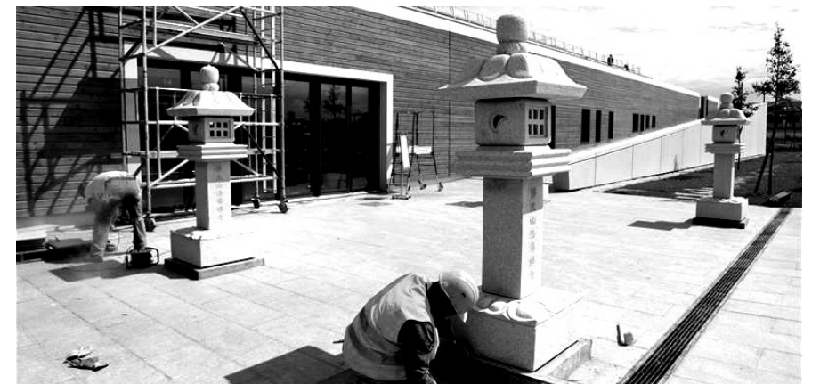
프랑스 부시 생 조르주 시에는 불교·이슬람교·기독교가 공존하는 유럽 최대의 종교시설이 들어선다.

프랑스 파리 인근의 소도시인 부시 생 조르주 시가 종교간 화합을 추진해 눈길을 끈다.