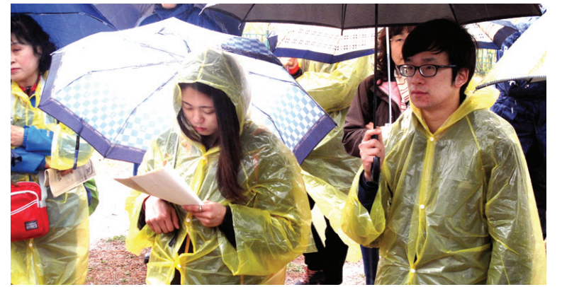
우천에도 많은 답사객들이 참석했다.