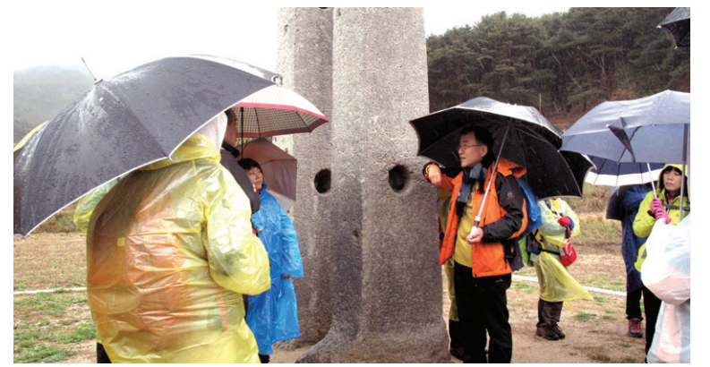
남간사지 당간지주. 남산의 사찰과 사지 중 유일한 당간지주다.