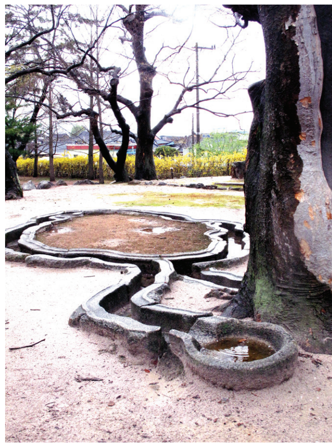
경주 남산 아래 위치한 포석정. 연회 장소만이 아닌 종교적 성소로 이용했음으로 추정된다.