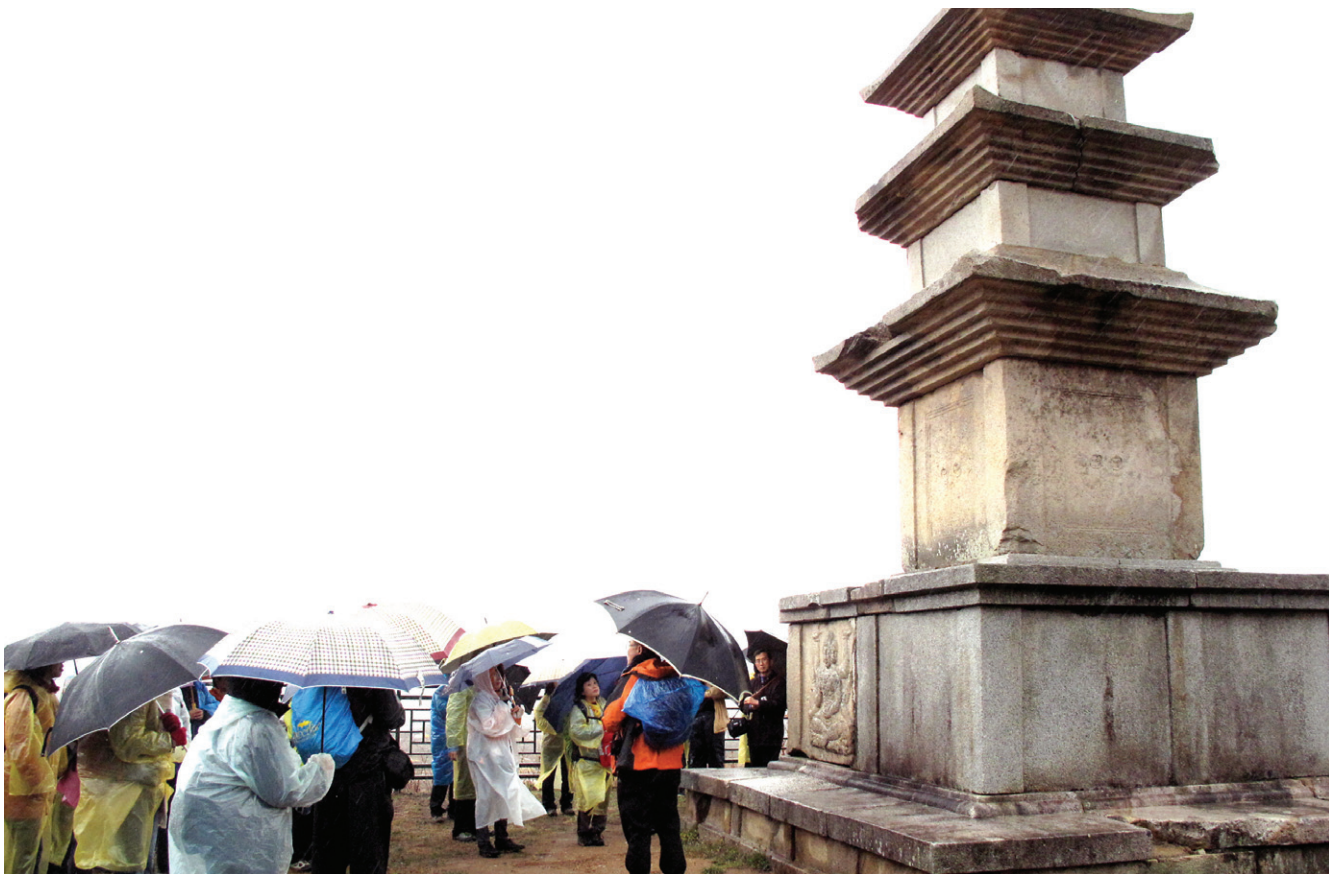
답사단이 남산 창림사지 삼층석탑에서 관련 설명을 듣고 있다. 창림사지 석탑은 남산에서 가장 큰 탑으로 7m에 달한다.