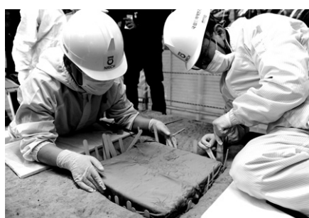
조심스럽게 사리공 덮개석을 들어올리는 모습.

불국사는 이날 오후 4시부터 무설전에서 '진신사리 친견법회 임제식'을 거행했