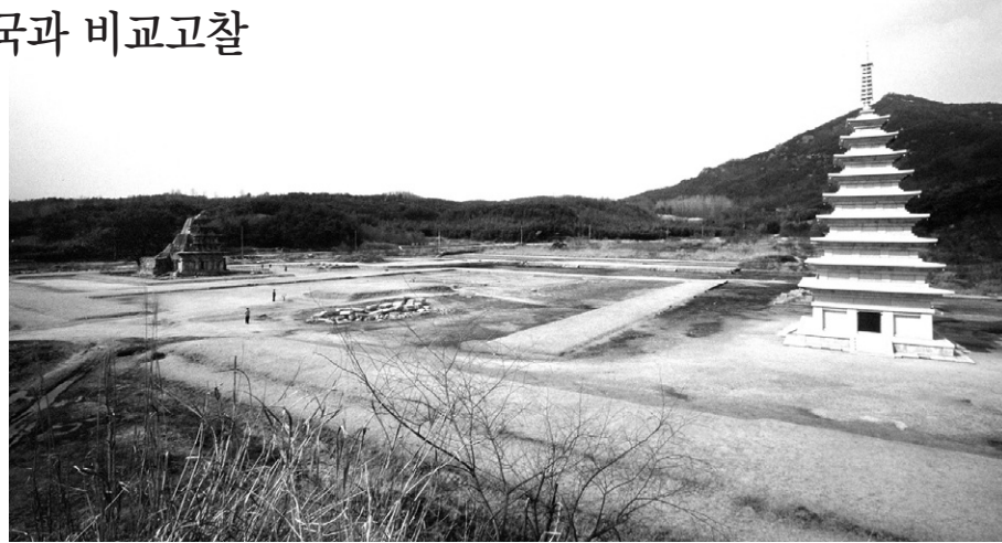
백제 미륵사는 동진·수·고구려의 건축기술과 백제의 독창적 미학이 함께 어우러진 당대 건축문화의 백미였다.

사찰의 비교'에서 "백제는 중국으로 불교 문화를 수용해 중국과의 유사성이 적지 않지만 단순히 중국문화를 수용하는데 그치지 않고 이를 적극적으로 변용해 백제적 특징을 창출했다"고 말했다.