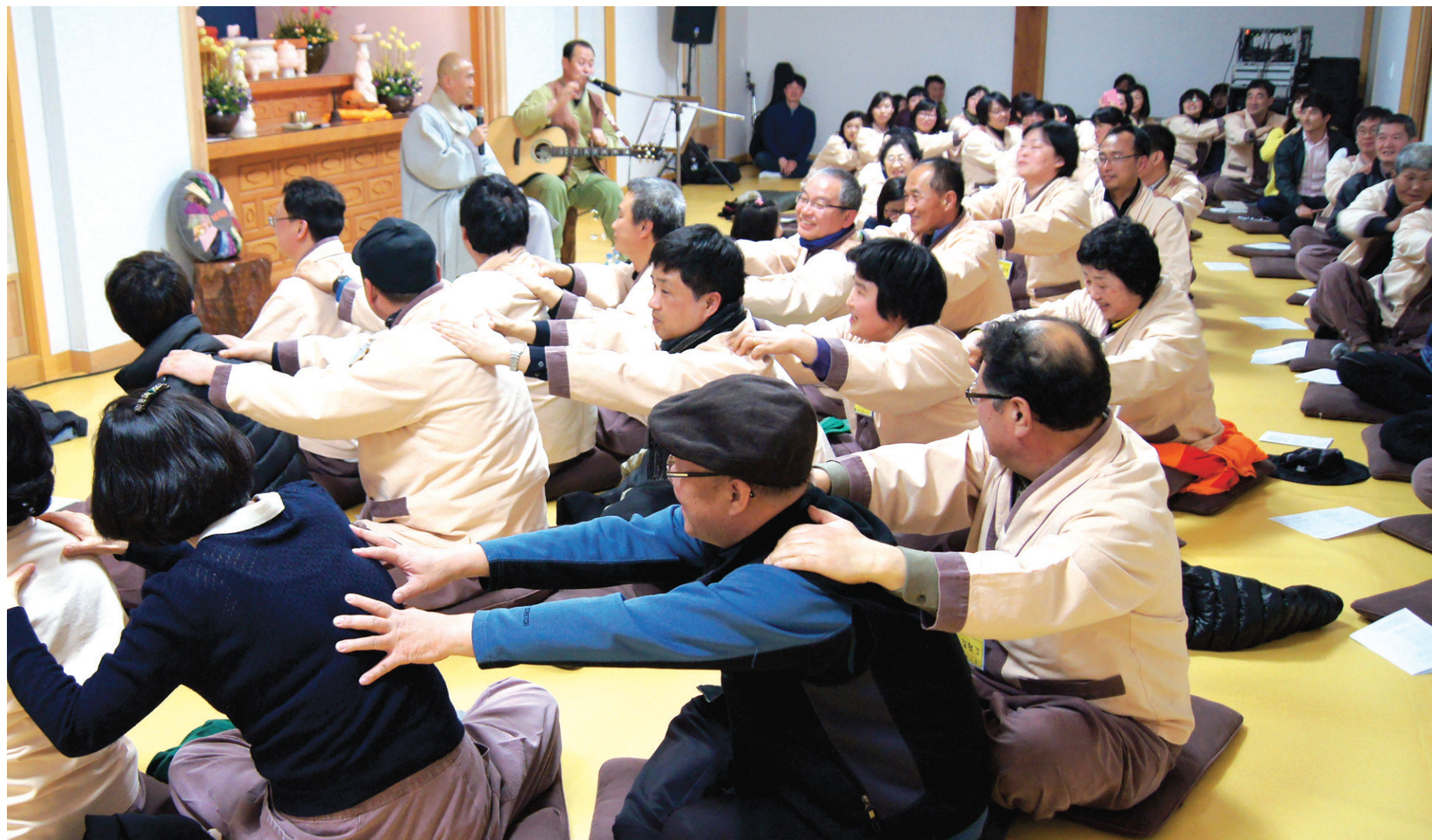
3월 29일 금산사에서 열린 '내비뒤 콘서트'에서 신나는 노래에 맞춰 서로의 어깨를 주물러 주며 즐거운 한때를 보내는 해고 노동자들. 함께 노래하고 즐기는 동안 이들의 마음은 분노 녹듯 풀려가고 있었다.