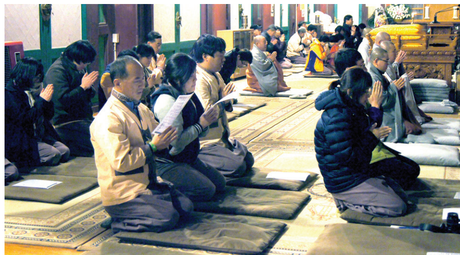
새벽예불과 108배 시간에는 그동안의 고생으로 눈물을 쏟아낸 참가자들이 많았다.