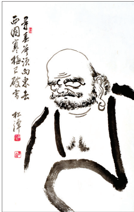
송담 스님의 달마도