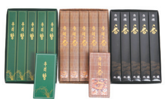
우리향, 백단향, 설중매, 인삼향, 대발향, 속향