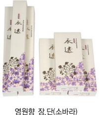
영원한 장, 단소바라