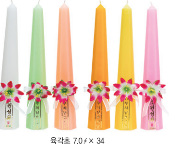
육각초 7.0 x 34