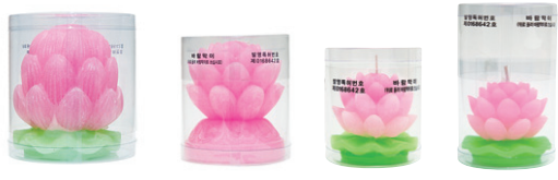
연화 대 9.5 x 11cm, 연화 중 9 x 10cm, 연화 소 7 x 6.5cm