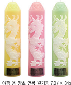
아광 용 양초 연봉 원기둥 7.0 x 34cm