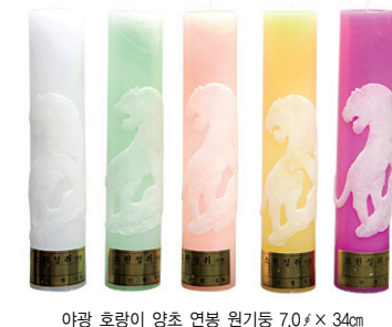
아광 호랑이 양초 연봉 원기둥 7.0 x 34cm