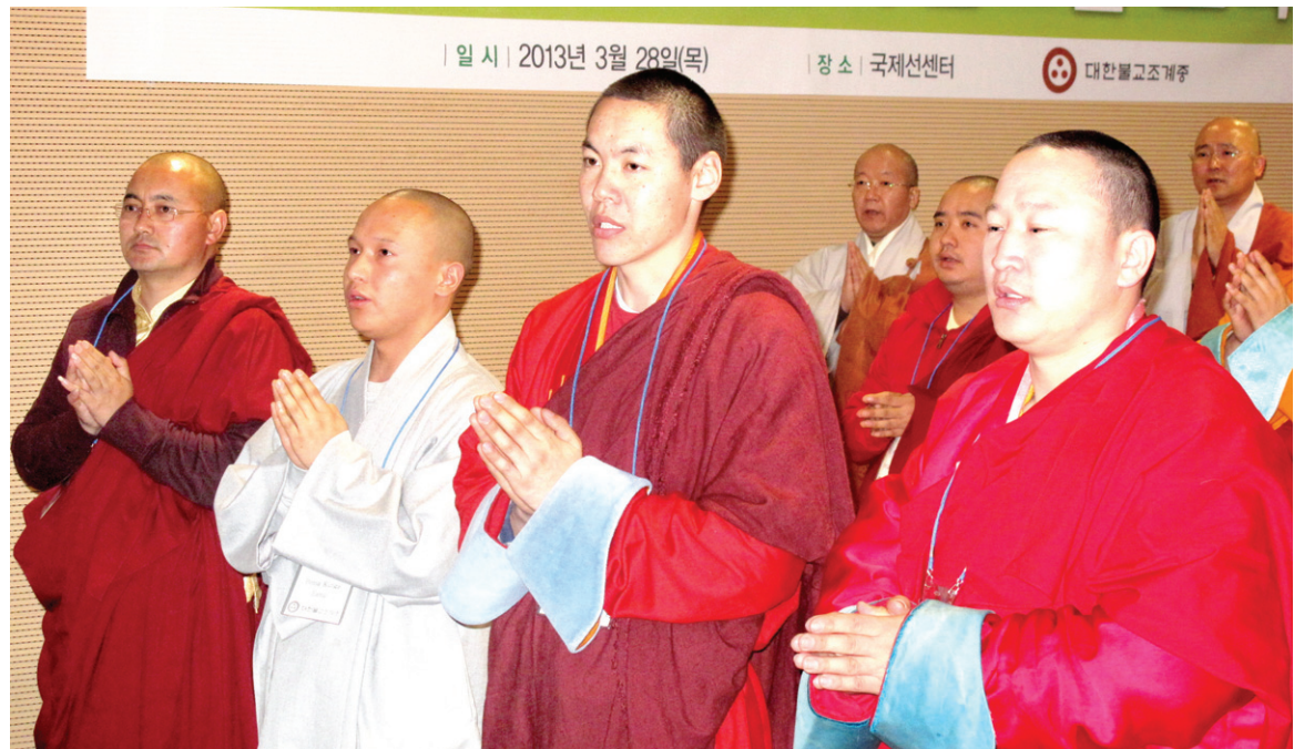
3월 28일 조계종 사회부가 개최한 외국인 스님 교육에 참가한 스님들이 한국어 전통 의식으로 입재식을 갖고 있다.

어린이 불서를 보급양 받고 싶은 독자와 사찰에서는 문의 전화나 이메일(motp79@hyunbul.com)로 신청해 주십시오.