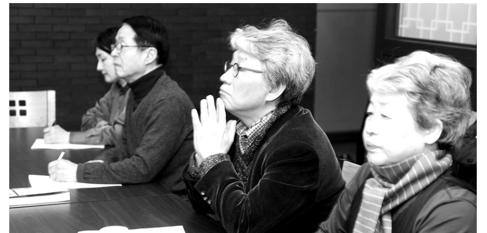
청중들이 이성동 박사의 '선과 뇌과학' 강의를 진지하게 듣고있다.

것을 듣는 것입니다. '어디가 아파요' 하는데 실험적으로 아프다는 것이 없다면 아프지 않는 것이라고 할 것입니까. 이를 달리 생각해서 선정의 깊은 체험을 뇌과학에서의 기계에서 나오지 않는다고 하면 없다고 할 것입니까.