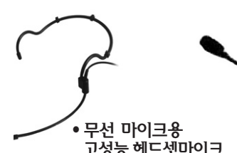
•무선 마이크용 고성능 헤드셋마이크

◆특징: 자체 제작하는 스피커로 소리가 웅장합니다. 핀 마이크와 잘 맞습니다.