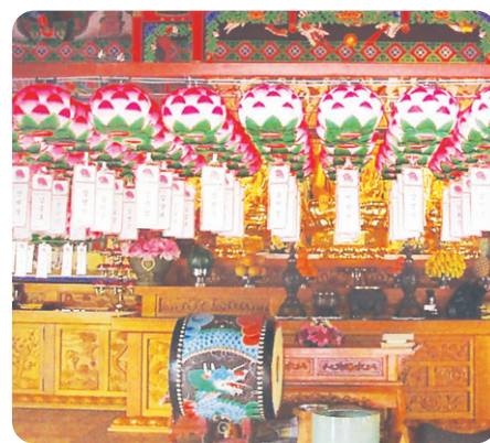
연등 자동 승강장치 _ 흥은사