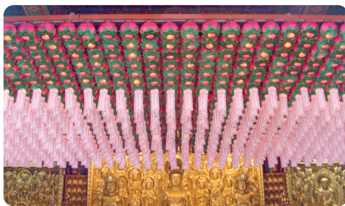
연등 자동 승강장치 _ 도선사