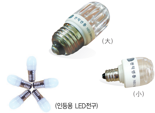
1년 365일, 하루 6시간 사용 전기요금: 98원/1kwh