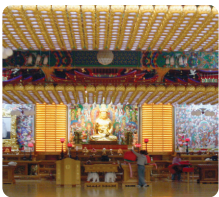
연등 자동 승강장치 _ 안산 월강사