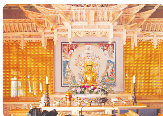
용주사 LED 인등