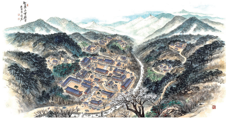
이호신 작가의 '구례 화암사'. 작가는 지리산을 배경으로 한 작품 200여 점을 이번 전시에서 선보인다.