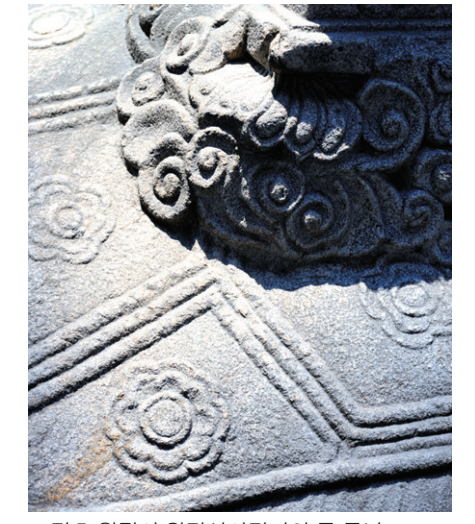
그림② 월광사 원랑선사탑비의 등 무늬