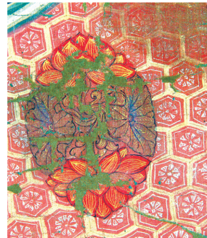
그림③ 가가미 신사 소장, 고려 수월관음도의 차마