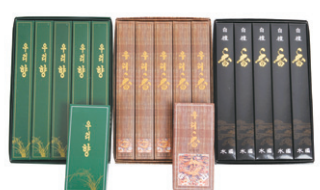
우리향, 백단향, 설중매, 인삼향, 대법향, 속향