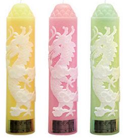
아광 용 양초 연봉 원기둥 7.0 x 34cm