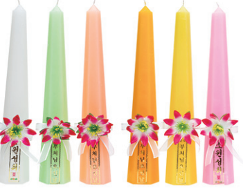
육각초 7.0 x 34