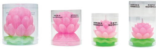
연화 대 9.5 x 11cm, 연화 중 9 x 10cm, 연화 소 7 x 6.5cm