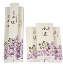
영원한 장, 단소바라