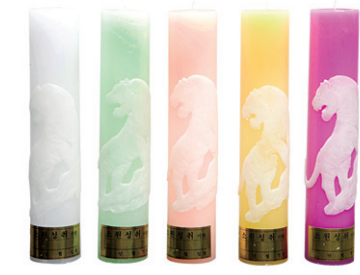
아광 호랑이 양초 연봉 원기둥 7.0 x 34cm

삼환양초는 향료를 사용하지 않고 100% 자연향을 원료로 하여 고객만족을 실현하고 있습니다